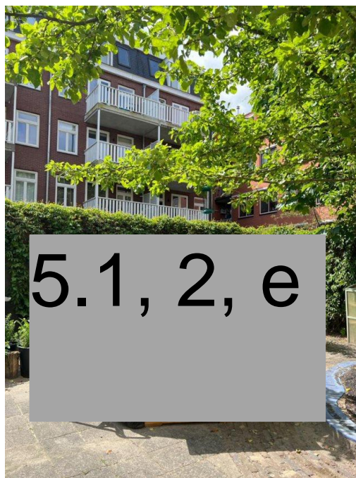
Koffie-uurtje in de tuin

Om het bereik van de buurtkamer te vergroten is er een website en huisstijl in aanbouw, naar verwachting is deze de tweede helft van het jaar klaar. Om de activiteiten en de buurtkamer wel al onder de aandacht te kunnen brengen is er een Facebook- en Instagrampagina aangemaakt waar geregeld op wordt gepost, net als in diverse Facebookkanalen en WhatsApp groepen. Om een breed publiek te kunnen trekken, en dus ook minder digitaal-sterke buurtbewoners te kunnen bereiken, zijn er ook fysieke flyers gemaakt en verspreid in de wijk. Tot slot wordt er waar mogelijk gebruik gemaakt van aanbod dat fysiek wordt gedeeld, zoals de Zomer in Zuid krant bijvoorbeeld.