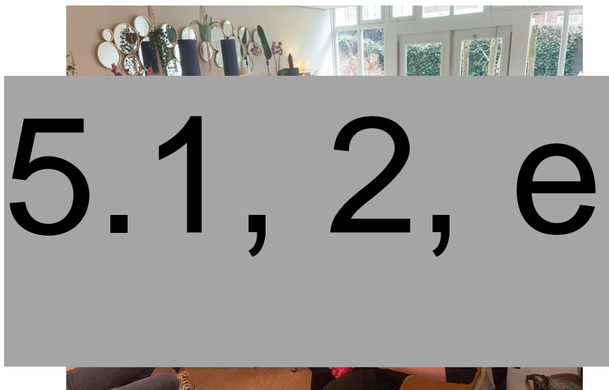
Netwerklunch van het TWES-overleg

Het afgelopen half jaar is de buurtkamer geregeld onder de aandacht gebracht bij het netwerk om zo toeleiding naar de buurtkamer te vergroten en de buurtkamer als mogelijke locatie voor aanbod onder de aandacht te brengen. Er zijn bijvoorbeeld diverse netwerkoverleggen georganiseerd in de buurtkamer zoals een Wijktafel, het lvb expertisenetwerk Zuid en het stedelijke informele platform.