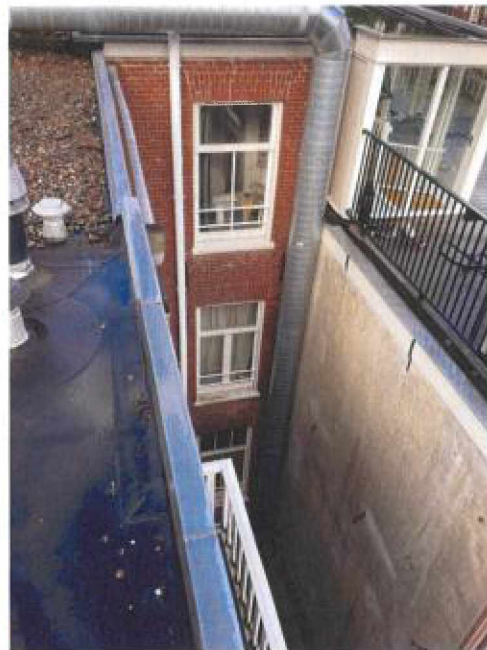
Bovenste twee foto's gemaakt vanaf het dak van Willemsparkweg 218