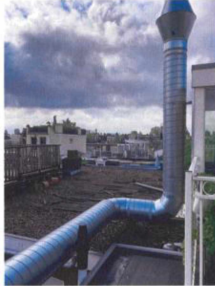
Dak terras 4e verdieping afvoerkanaal versleekt, deels over het dak van Willemsparkweg 218.