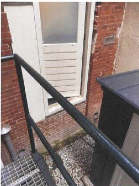
Deur kan beperkt open