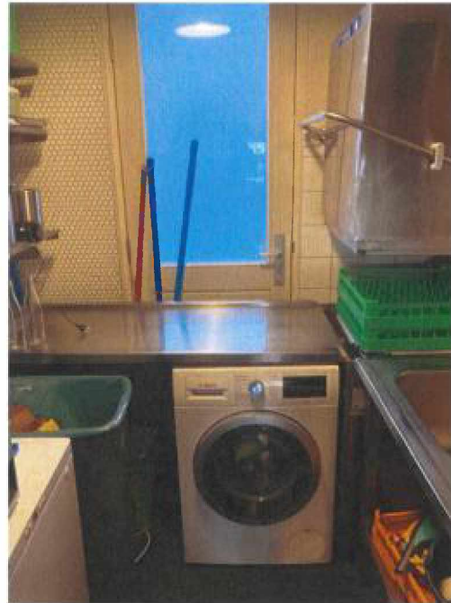
Binnenzijde van het restaurant kozijn / deur Deur is nooit in gebruik i.v.m. obstakels.