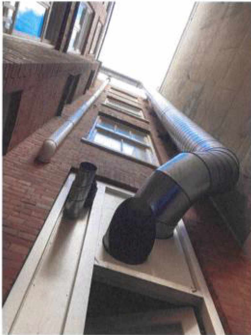
Gevel achterzijde van het restaurant (hoekpand).