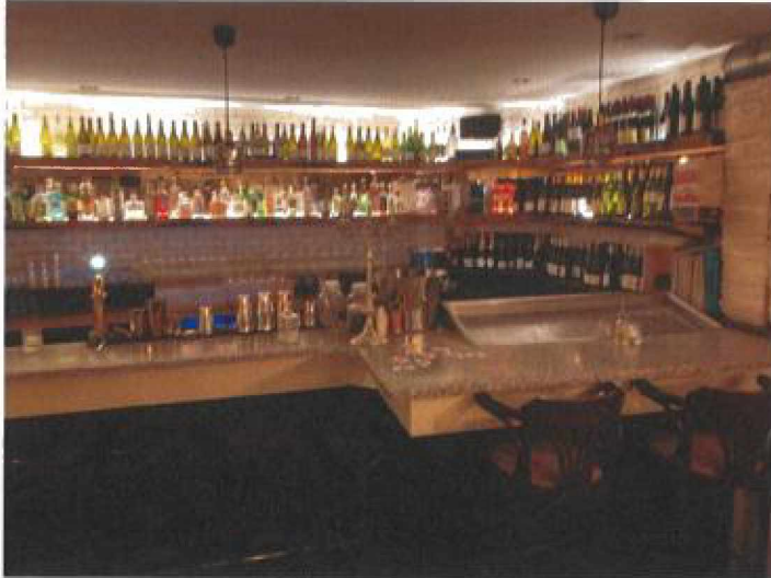
Kelder bar voorzienide gesitueerd naar de straatkant Willemsparkweg.