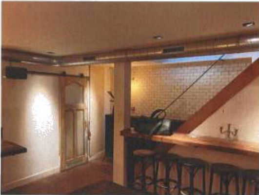
Kelder met (vlucht)trap