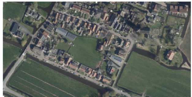
Luchtfoto huidige situatie