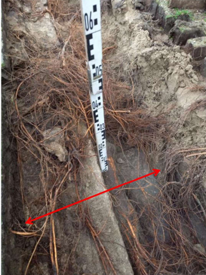
Figuur 4: foto van proefsleuf t.h.v. huisnr 168. Duidelijke te zien is de kademuur (rode pijl) met de versmalling en dikke wortel die naast versmalling ligt.

maken met de versmalde bovenzijde van de kadeconstructie. Dat maakt dat ook op met deze variant boombehoud op deze locatie niet mogelijk is. Positief is dat de voor boombehoud ontwikkelde variant op de traditionele combiwandmethode wel op andere locaties toepasbaar kan zijn.