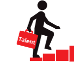
Doorstroom en doorgroei