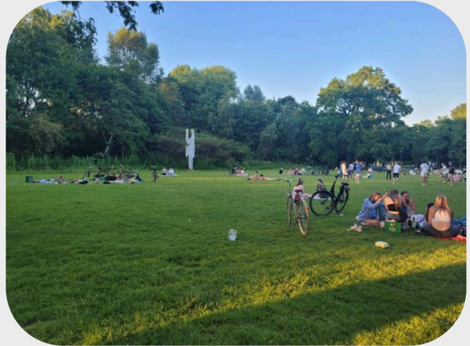
Picasso Veld Naast Vondel Theater