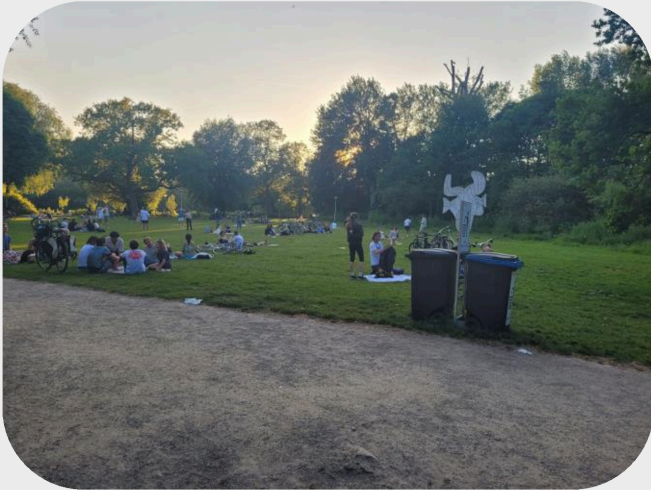
Picasso Veld Kinderbadje