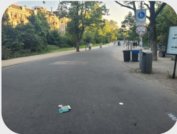
Ingang stadhouderskade Vondelmonument

Hieronder volgen foto's van de 5 fotopunten in het Vondelpark, deze zijn genomen vanuit de meest vervuilde hoek.