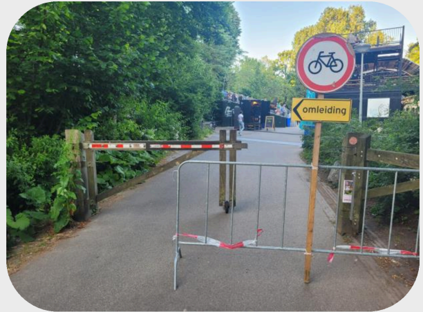
Vondel Theater Vondelmonument