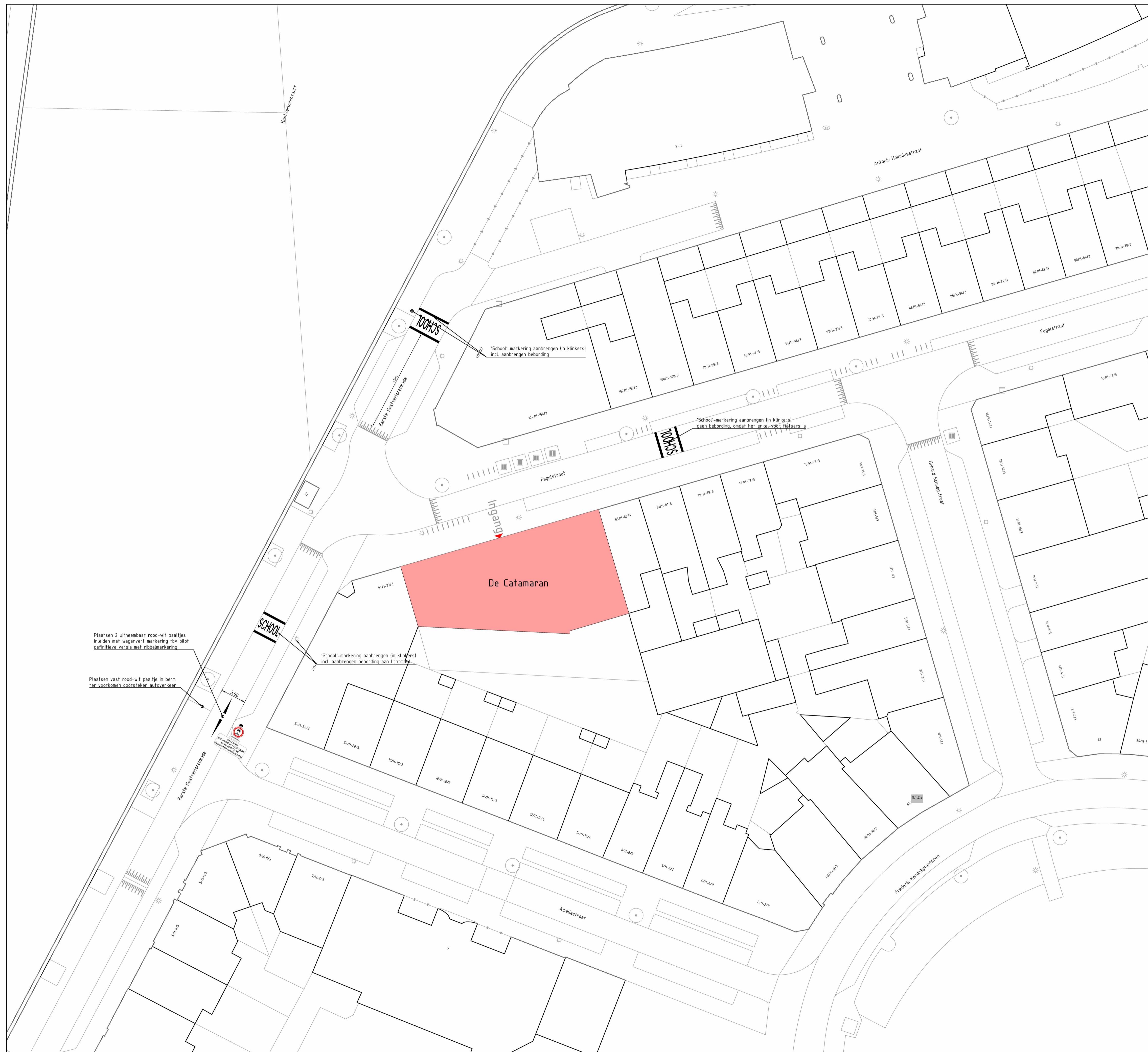
Situatie De Catamaran; Aanpassingen schoolomgeving Schaal 1:200