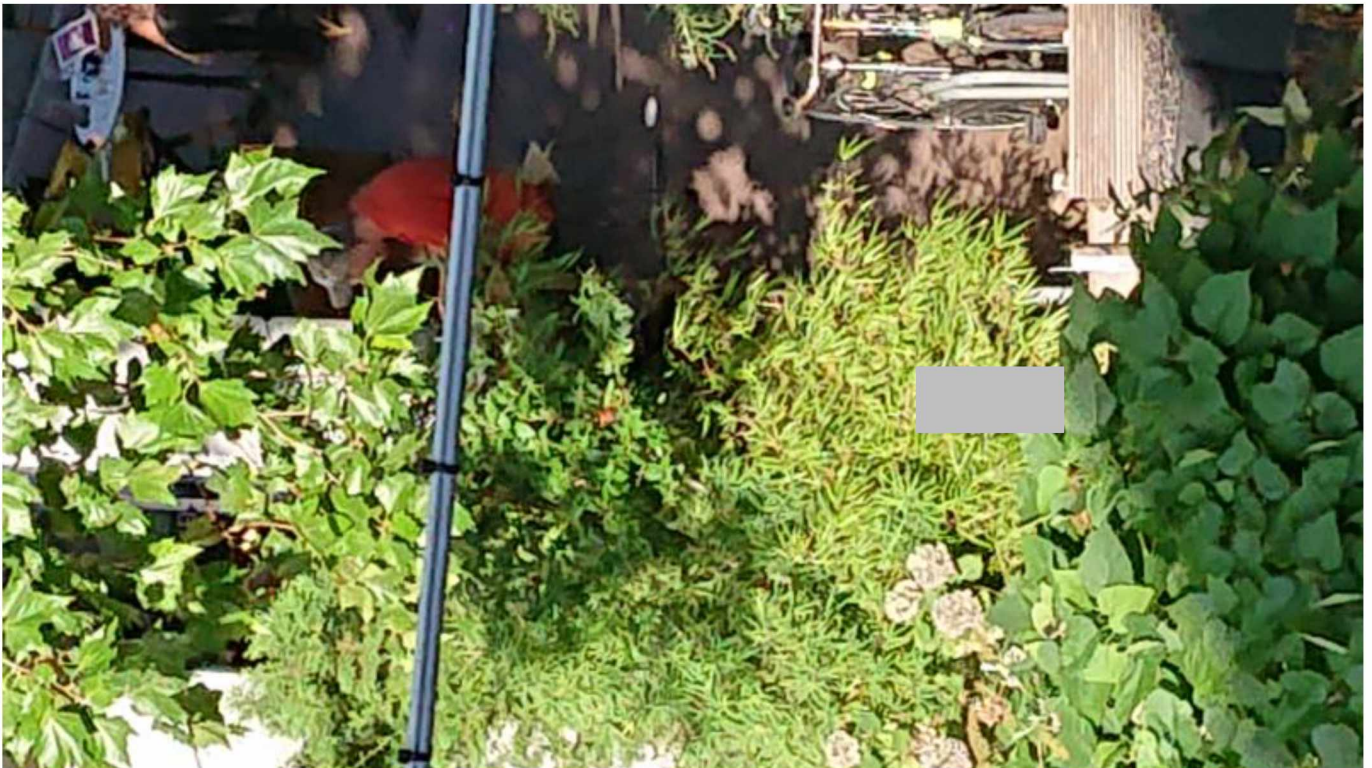
DSC_0201.JPG op 20-08-2022 17:23 door melder