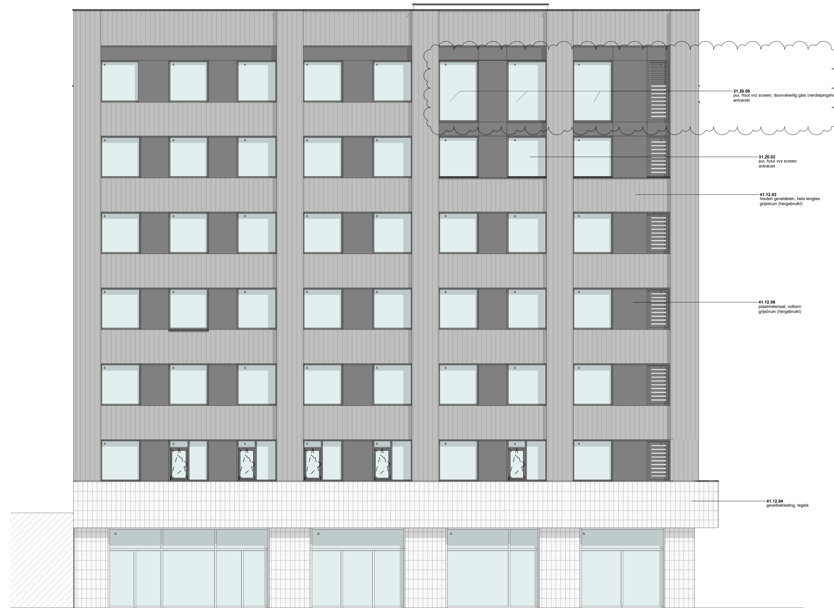
Gevel - Zuidoost aanzicht schaal 1:200

s = put voorzien van screen / zonwering of opvang bouwtechnisch adviseur r = akoestisch dempend rooster t.b.v. spuiverlatie of opvang akoestisch adviseur h = hergebruikte put (pijl) uitvoering & type n.l.b. definitieve indeling kan afwijken van getoonde indeling onder voorbehoud van beschikbaarheid en type hergebruikte putten hf = harbourfenster (dubbel kozijn t.b.v. akoestisch gedempte spuiverlatie) g = nestkast geruzeluis n.b. = plaatverdeling volkern beplating kan afwijken van getoonde verdeling onder invloed van de beschikbaarheid en verwerking hergebruikte platen