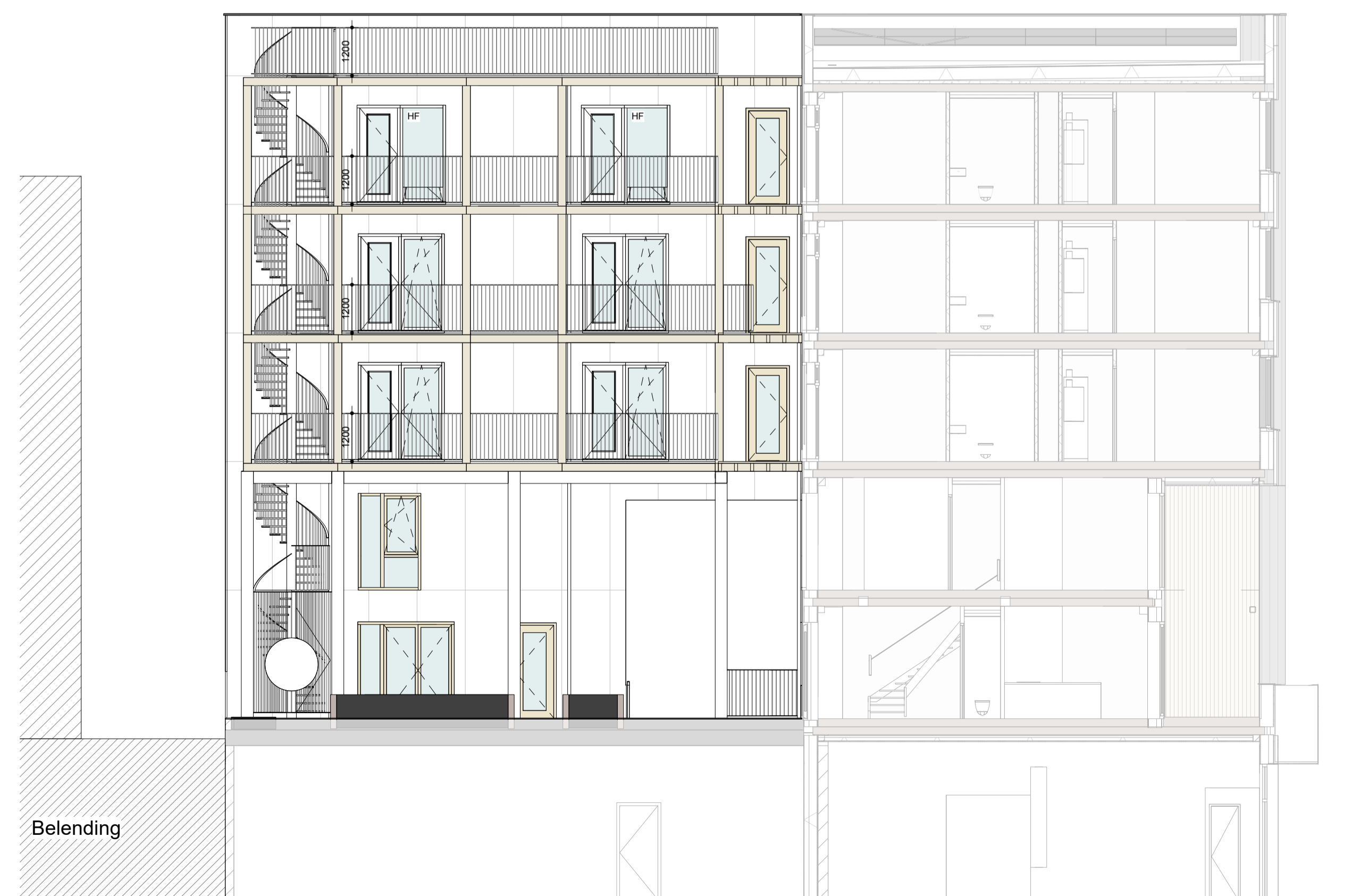
Binnengevel Noordwest aanzicht schaal 1:200

s = pui voorzien van screen / zonwering of opgave bouw fysisch adviseur r = akoestisch dempend rooster t.b.v. spuvelstade of opgave akoestisch adviseur h = hergebruikte pui (piet) uitvoering & type n.t.b. definitieve indeling kan afwijken van getekende indeling onder voorbehoud van beschikbaarheid en type hergebruikte puien hf = harbourfenster (dubbel kozijn t.b.v. akoestisch gedempte spuvelstade) g = nestkast gerzwaluw n.b. = plaatswijding volgens bepalend kan afwijken van getoonde verdeling onder invloed van de beschikbaarheid en verwerking hergebruikte platen