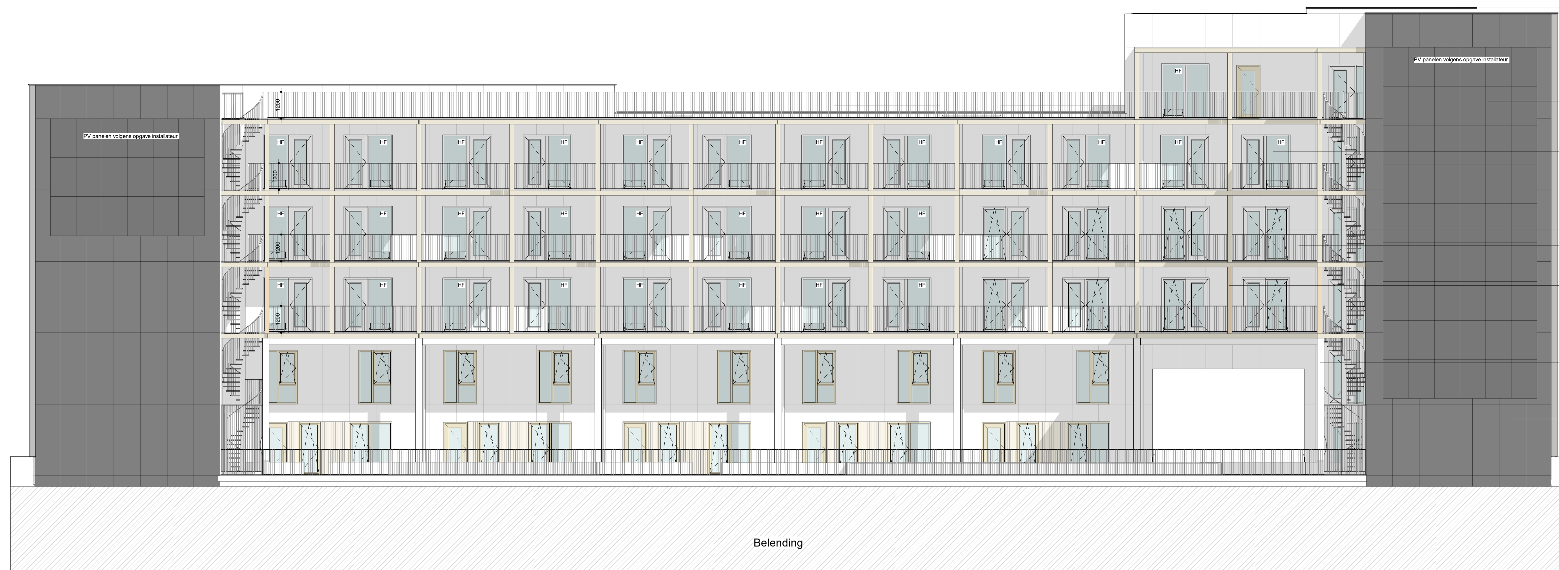
Binnengevel Zuidoost aanzicht schaal 1:200

s = pui voorzien van screen / zonwering of opgave bouw fysisch adviseur r = akoestisch dempend rooster t.b.v. spuvelstade of opgave akoestisch adviseur h = hergebruikte pui (piet) uitvoering & type n.t.b. definitieve indeling kan afwijken van getekende indeling onder voorbehoud van beschikbaarheid en type hergebruikte puien hf = harbourfenster (dubbel kozijn t.b.v. akoestisch gedempte spuvelstade) g = nestkast gerzwaluw n.b. = plaatswijding volgens bepalend kan afwijken van getoonde verdeling onder invloed van de beschikbaarheid en verwerking hergebruikte platen