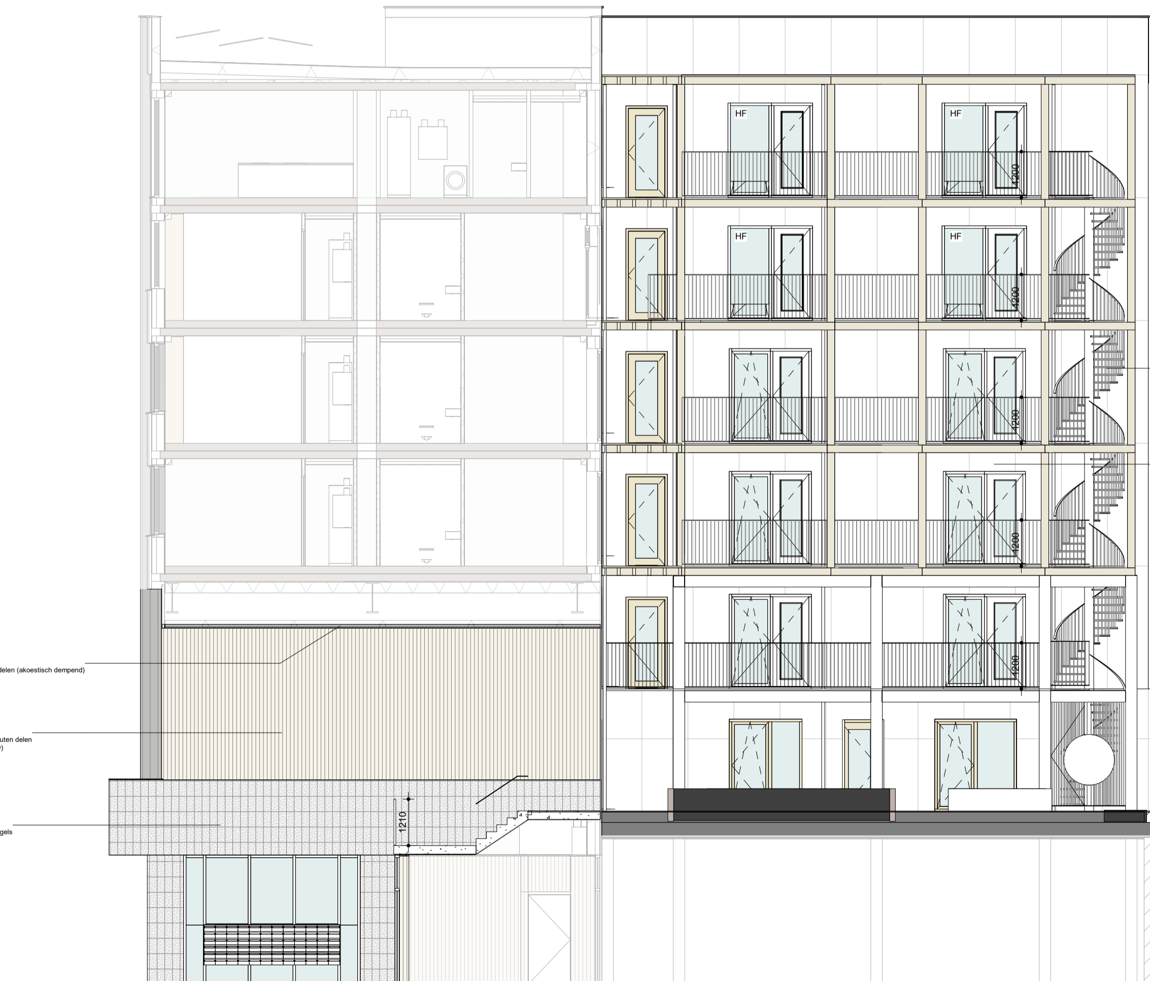
Gevel - Zuidwest schaal 1:200

s = pui voorzien van screen / zonwering of opgave bouw fysisch adviseur r = akoestisch dempend rooster t.b.v. spuvelstade of opgave akoestisch adviseur h = hergebruikte pui (piet) uitvoering & type n.t.b. definitieve indeling kan afwijken van getekende indeling onder voorbehoud van beschikbaarheid en type hergebruikte puien hf = harbourfenster (dubbel kozijn t.b.v. akoestisch gedempte spuvelstade) g = nestkast gerzwaluw n.b. = plaatswijding volgens bepalend kan afwijken van getoonde verdeling onder invloed van de beschikbaarheid en verwerking hergebruikte platen