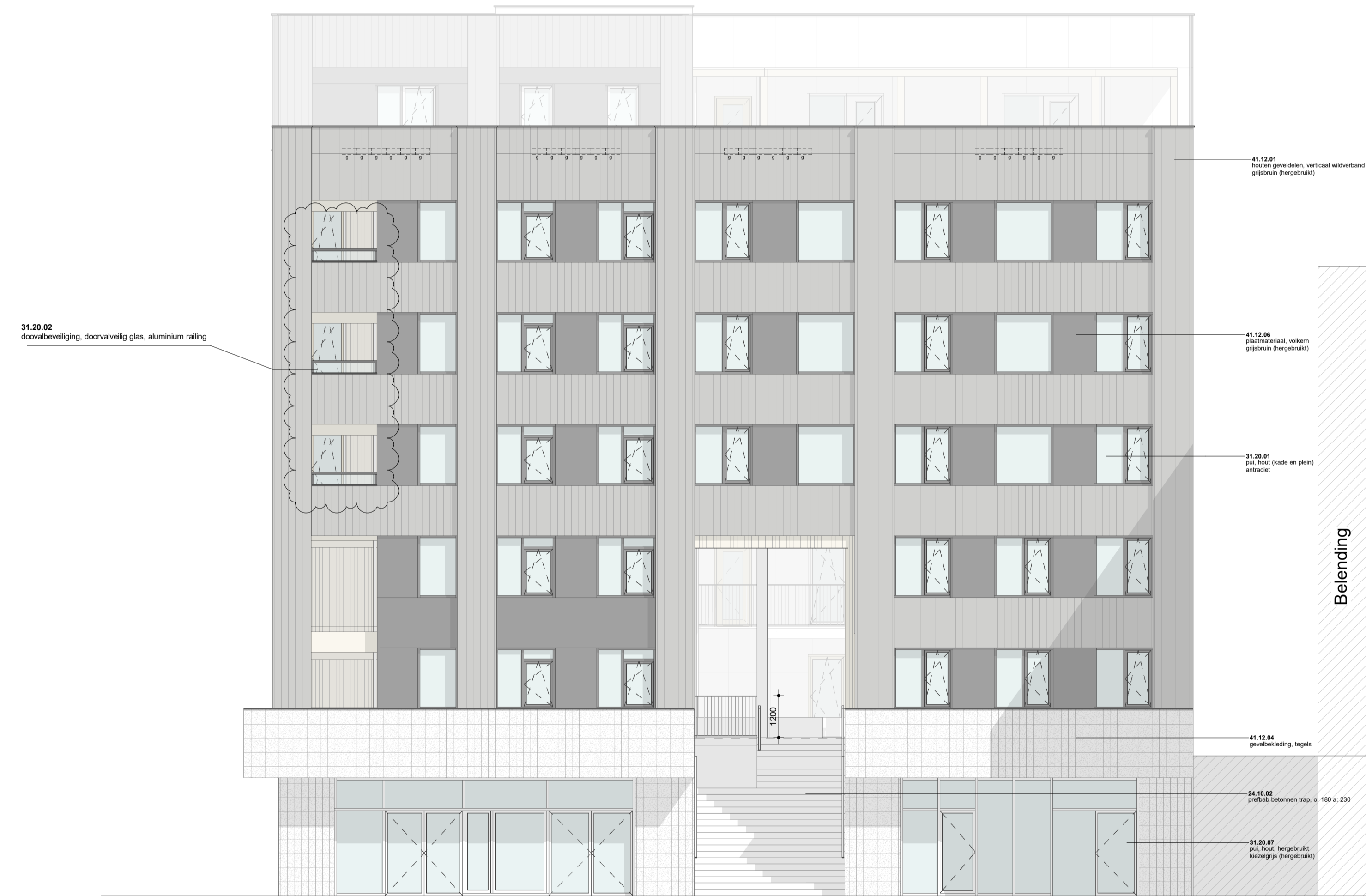
Gevel - Noordwest aanzicht schaal 1:200

s = put voorzien van screen / zonwering of opvang bouwtechnisch adviseur r = akoestisch dempend rooster t.b.v. spuiverlatie of opvang akoestisch adviseur h = hergebruikte put (pijl) uitvoering & type n.l.b. definitieve indeling kan afwijken van getoonde indeling onder voorbehoud van beschikbaarheid en type hergebruikte putten hf = harbourfenster (dubbel kozijn t.b.v. akoestisch gedempte spuiverlatie) g = nestkast geruzeluis n.b. = plaatverdeling volkern beplating kan afwijken van getoonde verdeling onder invloed van de beschikbaarheid en verwerking hergebruikte platen