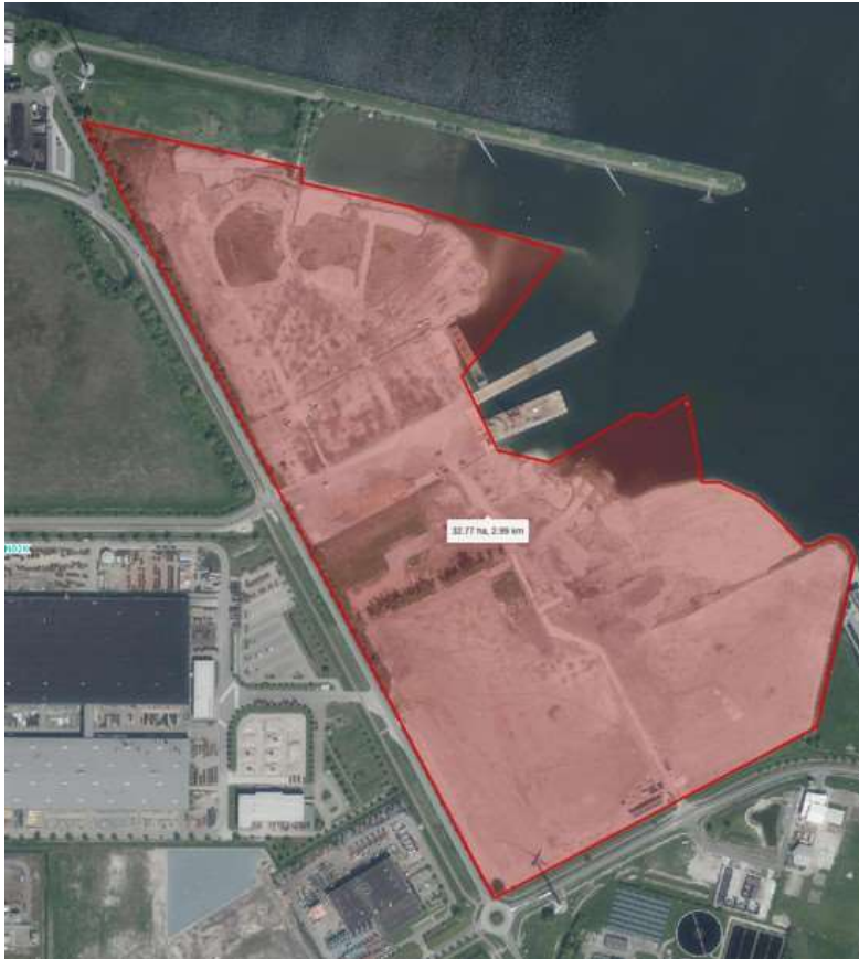
Luchtfoto van het ADM terrein met in rood een inschatting van de hoeveelheid land zoals die op de waardepeildatum (1/1/2024) aanwezig was