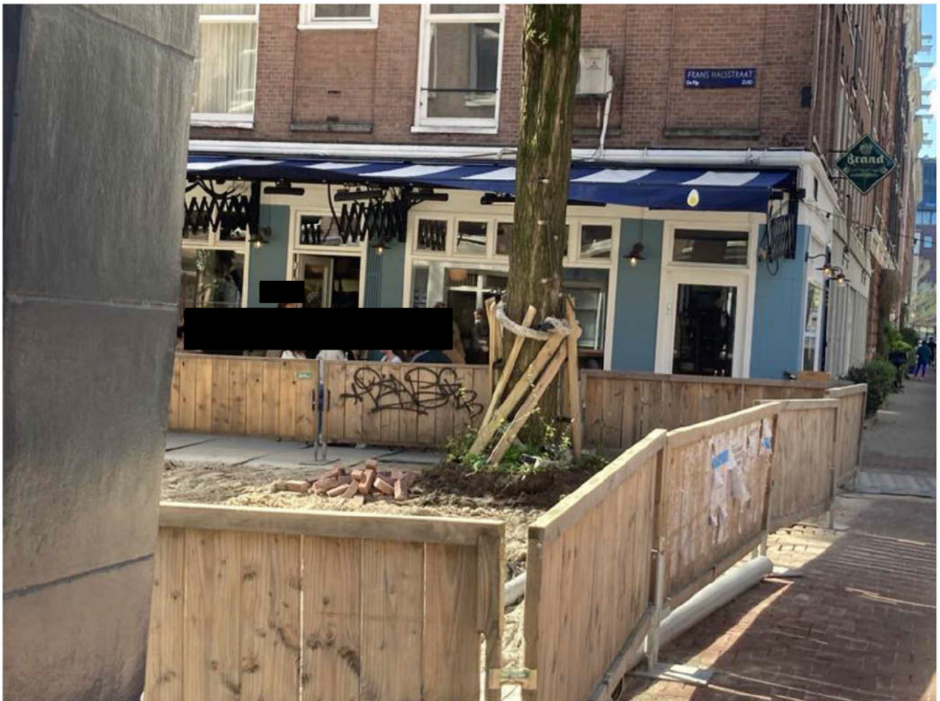
IMG_5368_eTpL1Bt.jpeg op 07-04-2024 15:16 door melder