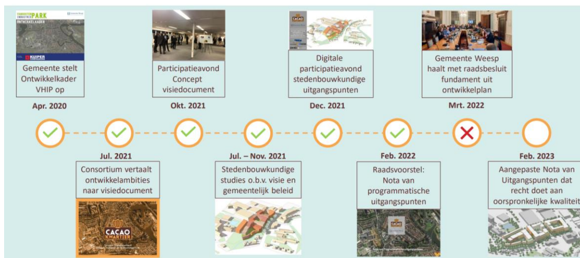
Figuur 1. Tijdlijn tot februari 2023

In onderstaande tijdlijn is weergegeven welke stappen in project Cacaokwartier hebben plaatsgevonden tot februari 2023. In februari 2023 is door initiatiefnemers een aangepaste nota van uitgangspunten voorgelegd aan de gemeente. In deze aangepaste nota van uitgangspunten hebben initiatiefnemers een voorstel gedaan dat zoveel mogelijk tegemoet komt aan het geamendeerde raadsbesluit van de toenmalige gemeenteraad van Weesp en recht doet aan de oorspronkelijke ruimtelijke kwaliteit van het plan.