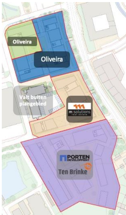
Figuur 3. Betrokken partijen Cacaokwartier.