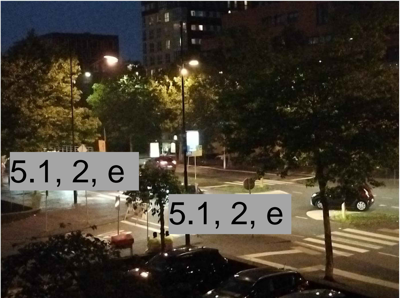
IMG_20250726_222400.jpg op 26-07-2025 22:30 door melder