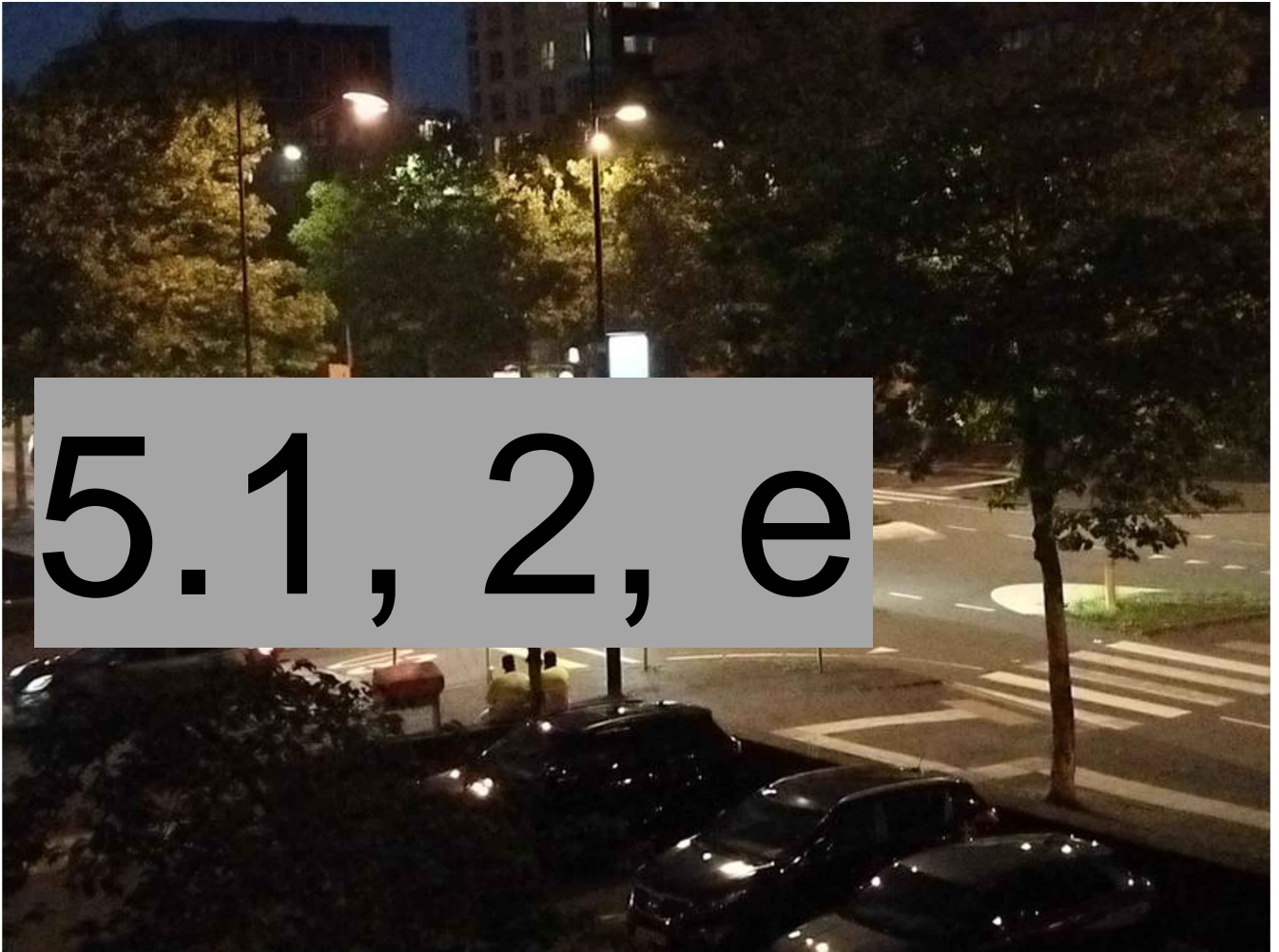
IMG_20250726_222405.jpg op 26-07-2025 22:30 door melder