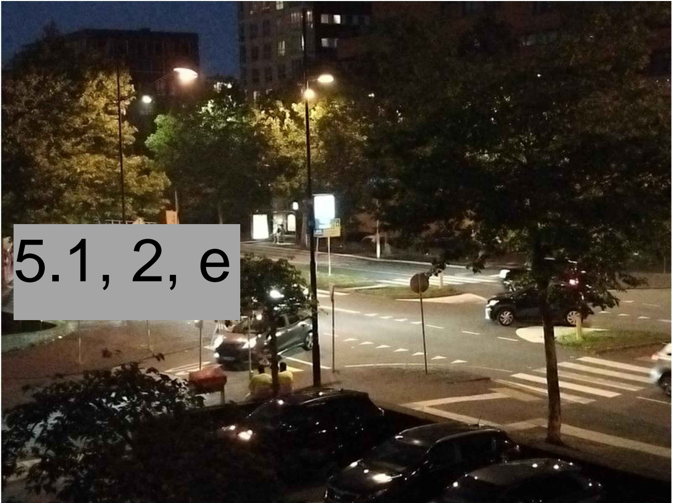
IMG_20250726_222403.jpg op 26-07-2025 22:30 door melder