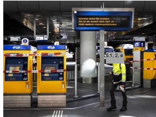
2022 | Landelijke NS-storing