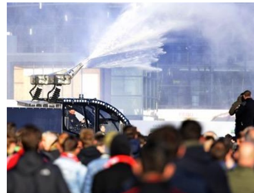
2019 | Rellen Ajax - Juventus