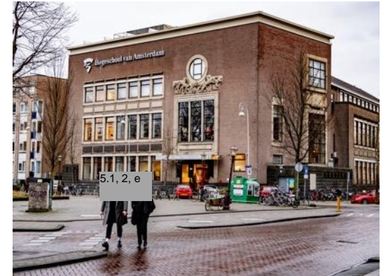
2021 | Cyberaanval HvA/UvA