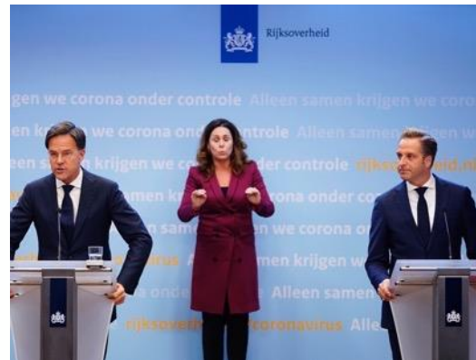
2020 | Coronacrisis