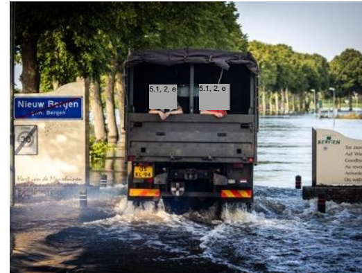
2021 | Hoogwater Limburg