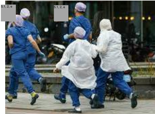
2023 | Erasmus schietincident