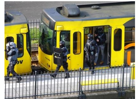
2019 | Schietincident Utrecht