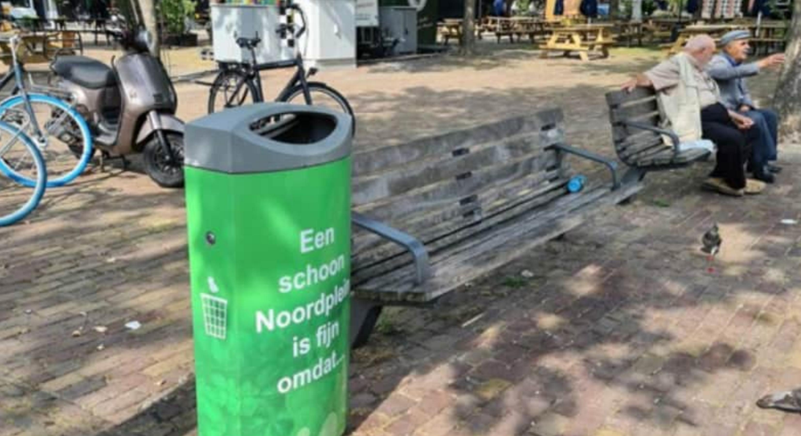
Opvallende afvalbak met zelf-overtuiging boodschap