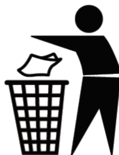
Symbool voor 'gooi je afval in de afvalbak'.

Communiceer het gewenste gedrag met behulp van pictogrammen en symbolen. Vaak spreken de tijdelijke bewoners van schepen aan de kade, zoals vluchtelingen, geen Nederlands of Engels. Daarnaast hebben zij te maken met veel stress. Het gebruik van pictogrammen en symbolen om het gewenste gedrag te communiceren kost de minste cognitieve capaciteit en is cultuur- en taal overstijgend.