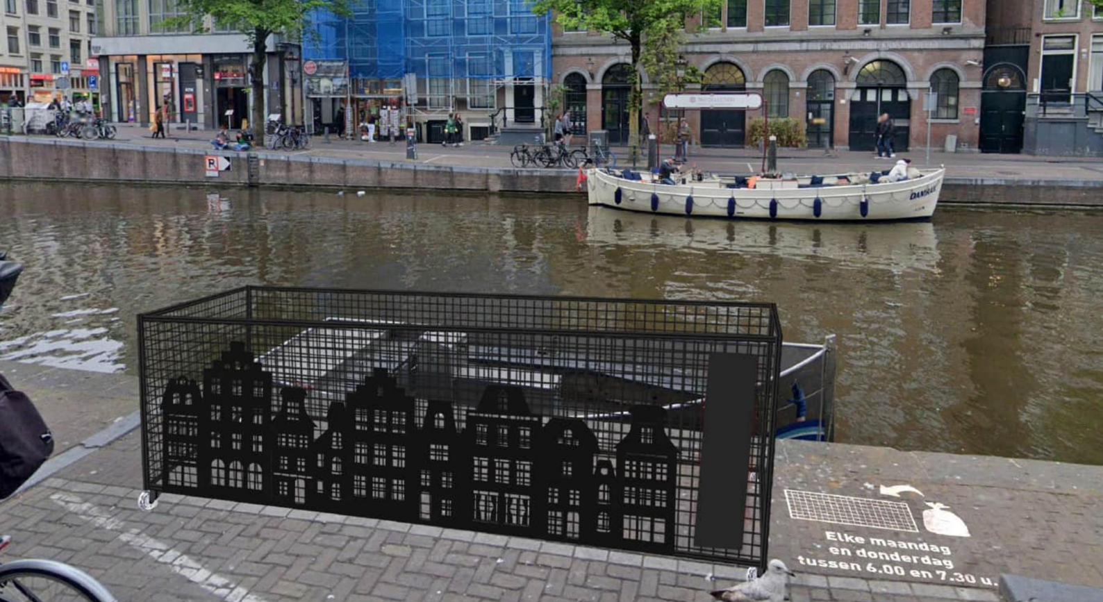
Afvalkorf met stoepcommunicatie en aanbiedtijden