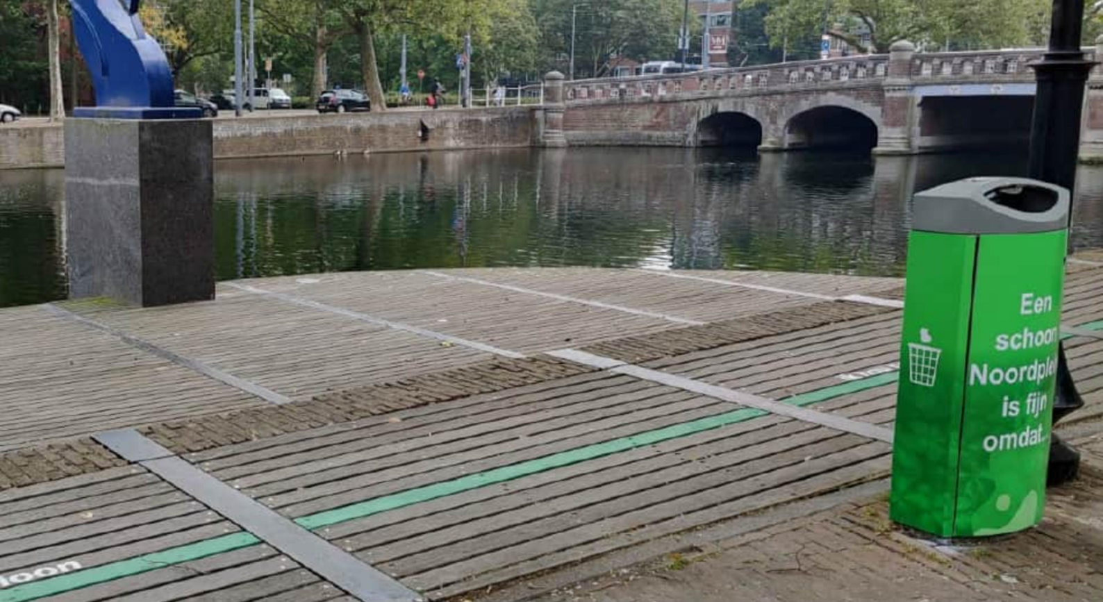
Opvallende afvalbak met zelf-overtuiging boodschap