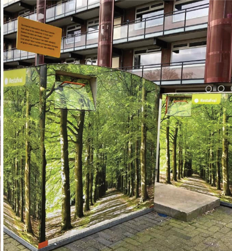
Placemaking bovengrondse container