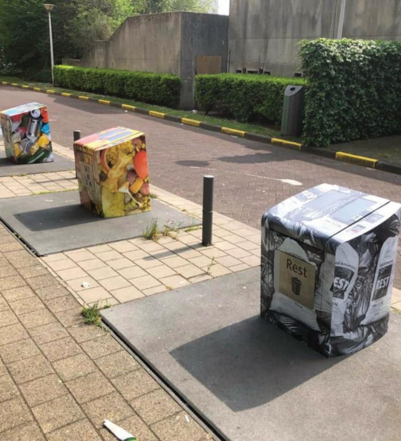
Placemaking ondergrondse containers