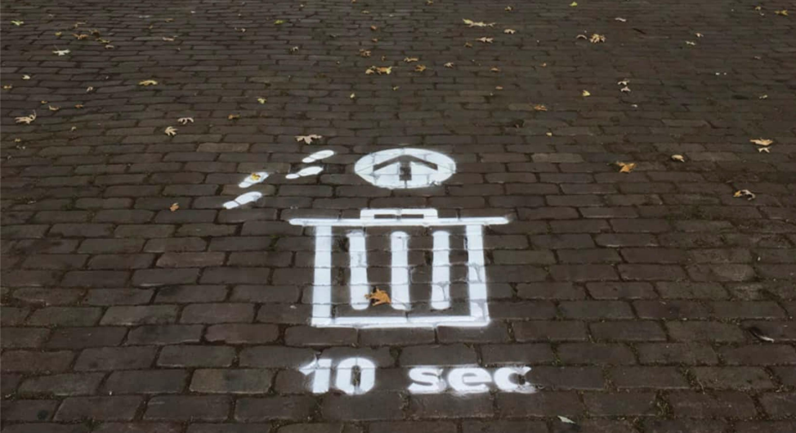
Nudge die verwijst naar een afvalbak