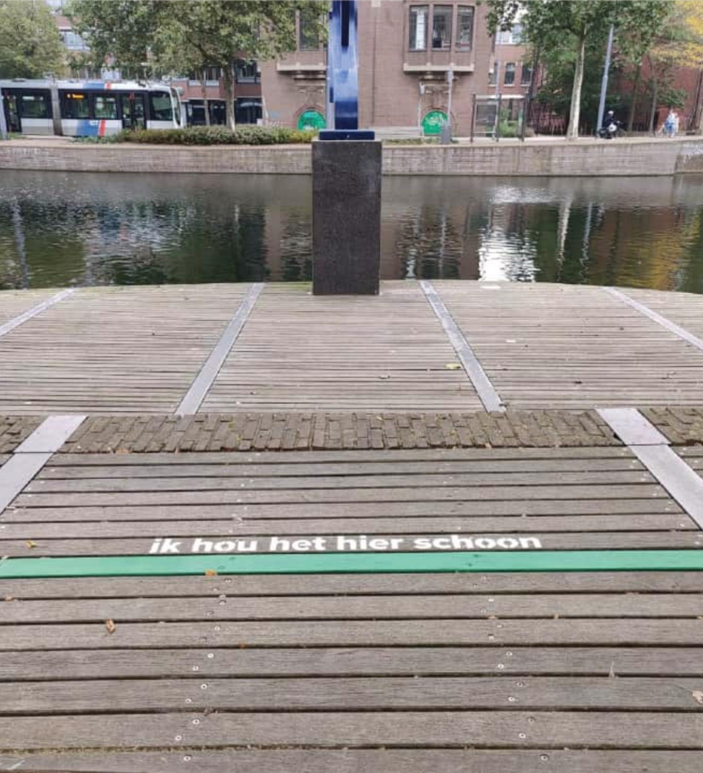
Commitment lijn op de vlonder