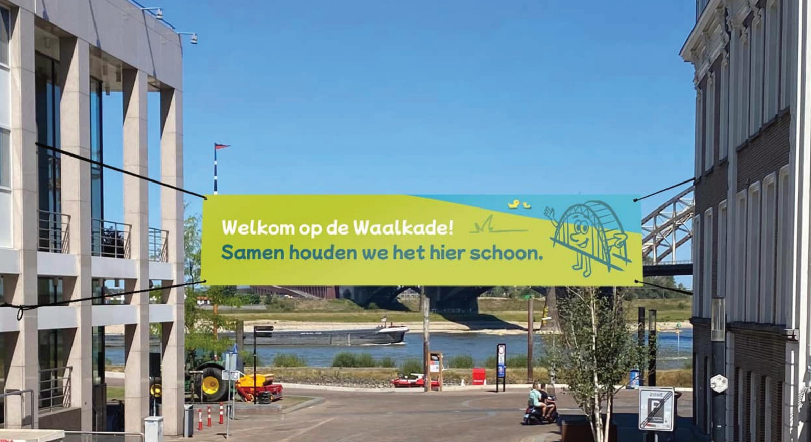
Banner bij betreden kade