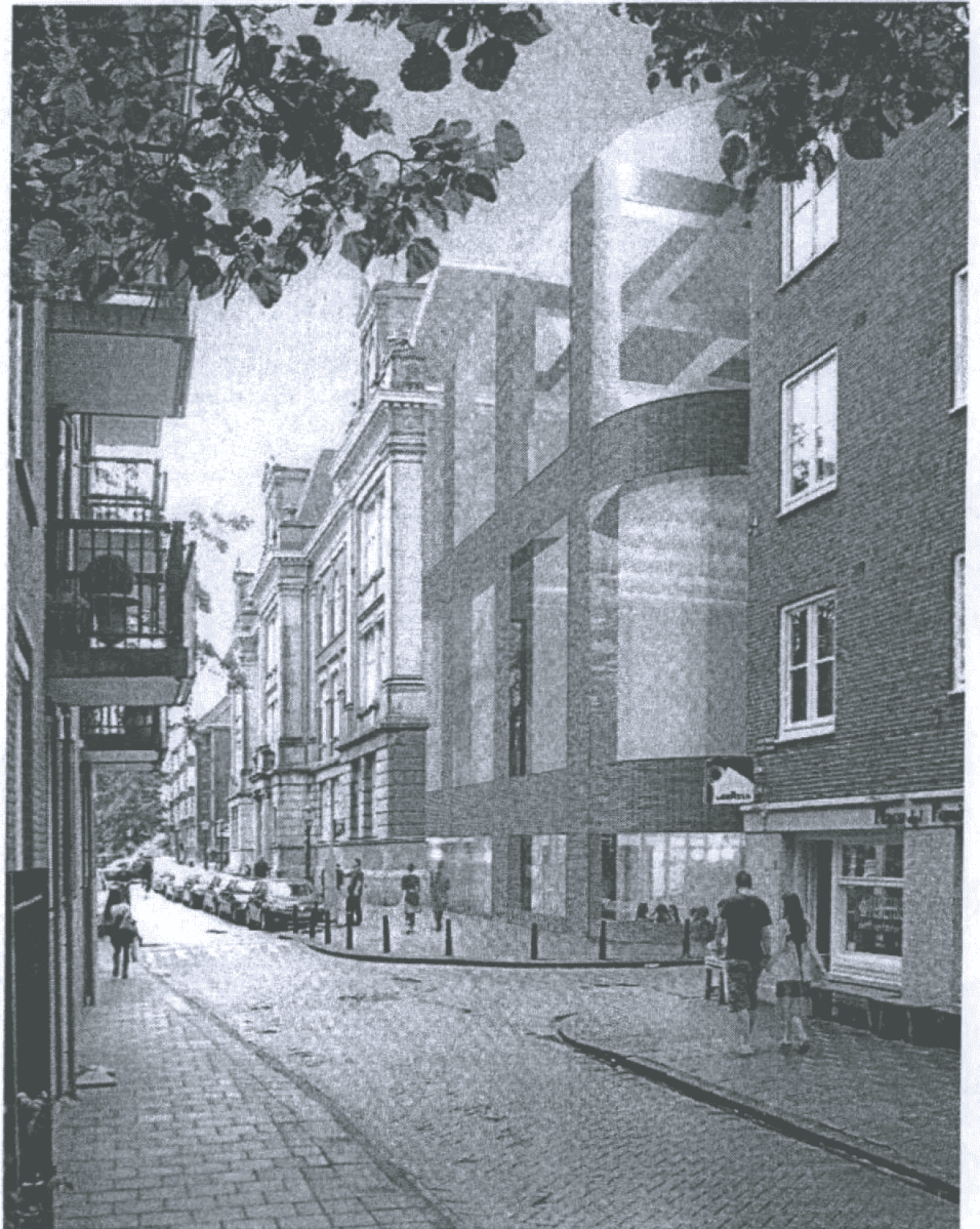
impressie hoek Raamplein - Raamstraat