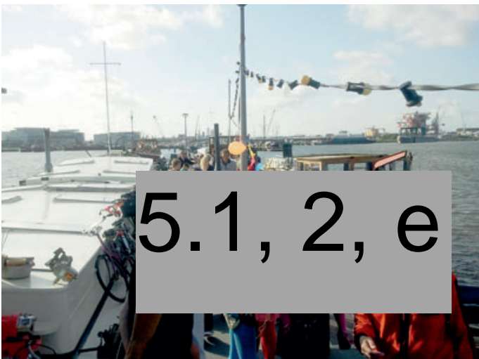
Afscheidsbarbecue op de steiger 29 juni 2011