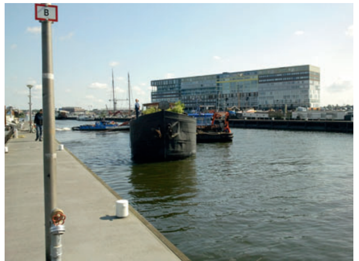
Verhuizing naar Oude Houthaven 30 juni 2011