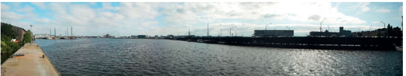
1 juli 2011 - verhuizing Fase 2 afgerond