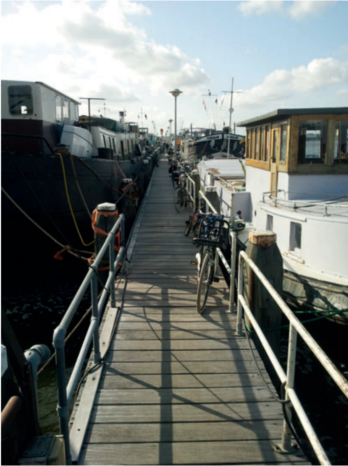
Steiger 3 - 29 juni 2011