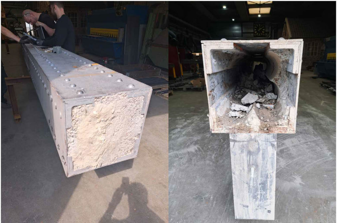
WhatsApp Image 2023-09-06 at 12.16.49.jpeg