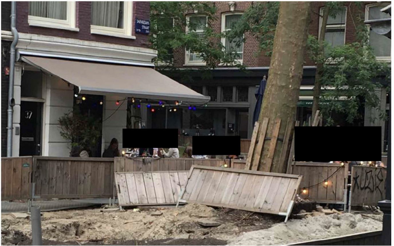
C53B512D-3FCE-455E-84C6-394AFA6FCAEB.jpeg op 26-07-2024 18:34 door melder