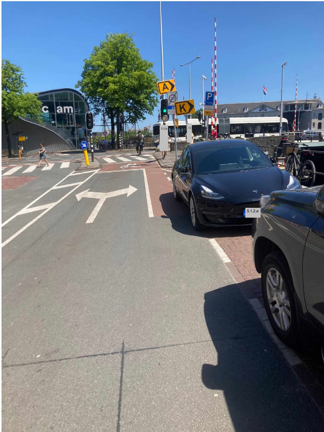
12. Einde Rapenburg --> bord dat er staat draaien + toevoegen bord 'Volg S100 pijl naar links'