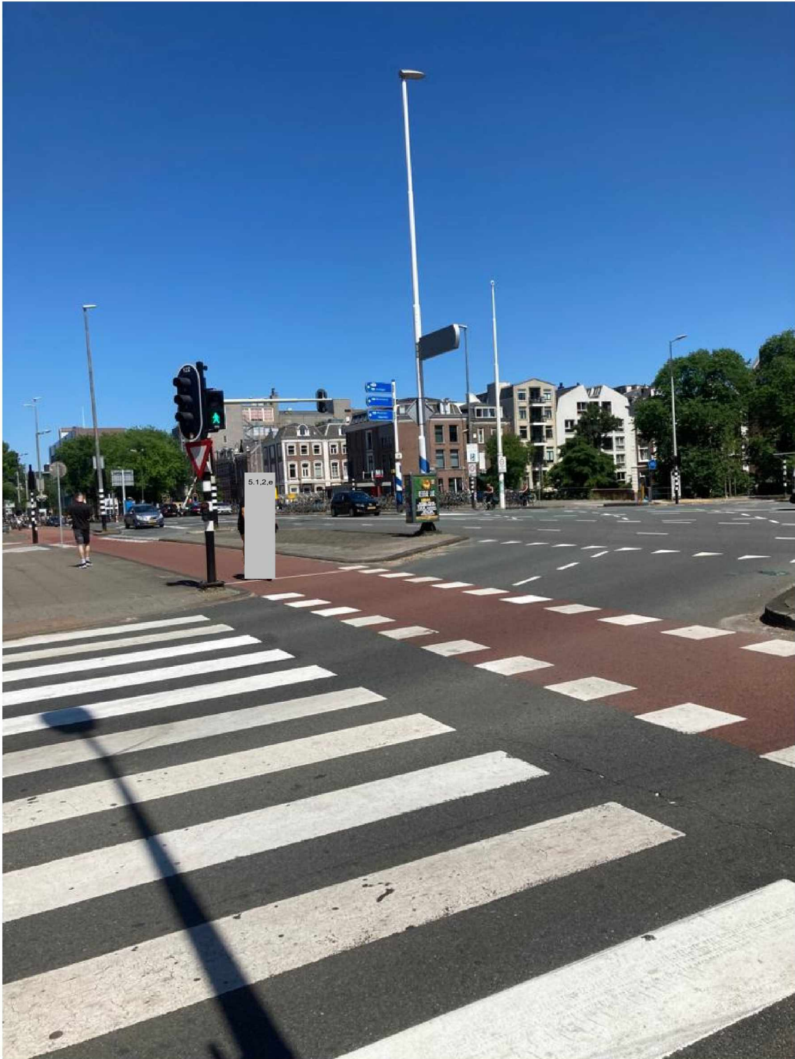
19. Rhijnspoorplein stad uit 'Weesperstraat afgesloten. Volg s100' bord