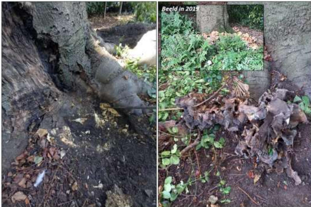
Aantasting onderzijde gestelwortels, met diepe intrede van prikstok (links). Rechts de aangetroffen vruchtlichamen van de reuzenzwam in 2022. In 2019 leek al ruim 2/3 van de stamvoet bezet met vruchtlichamen (zie inzet).

levensduurverlening. Behoud in sterk gereduceerde vorm als ecologische houtopstand past bovendien niet bij de betreffende keurtuinen en zou tevens de beeldbepalendheid van de boom teniet doen.