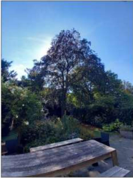
Overzichtsfoto van de beuk. Met name de transparante kroon valt op

De eigenaresse heeft de afgelopen jaren geld en moeite gestoken in het behoud van deze boom. In 2019 en 2022 is door de firma Copijn nader onderzoek uitgevoerd bij de boom. Sinds 2019 is de boom sterk in conditie achteruitgegaan. Waar in 2019 nog geconcludeerd kon worden dat er geen acuut gevaar voor windworp aanwezig was, blijkt de aantasting in 2022 zich dermate ontwikkeld te hebben dat Copijn de kans op windworp als reëel beoordeeld en adviseert kap binnen drie maanden.