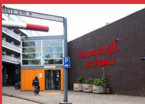
5.1, 2, e (naast Dirk van den Broek)