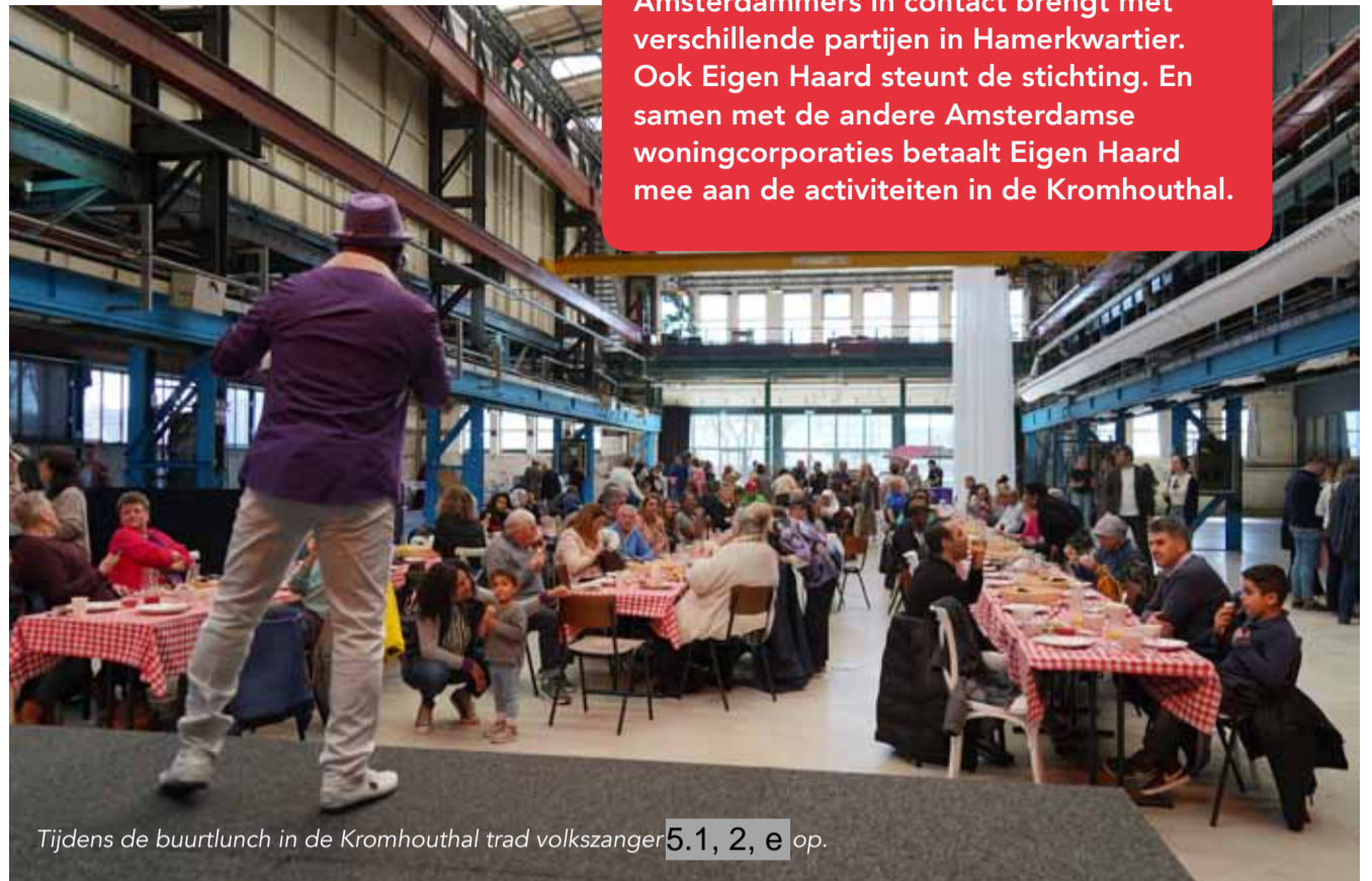
Tijdens de buurtlunch in de Kromhouthal trad volkszanger 5.1, 2, e op.

De directeur van de Kromhouthal steunt de plannen van de stichting. Hij stelt dit jaar vier keer de grote hal ter beschikking. En personeel 5.1.2.e en 5.1, 2, e maken daar graag gebruik van. Op 27 maart was er al een drukbezochte