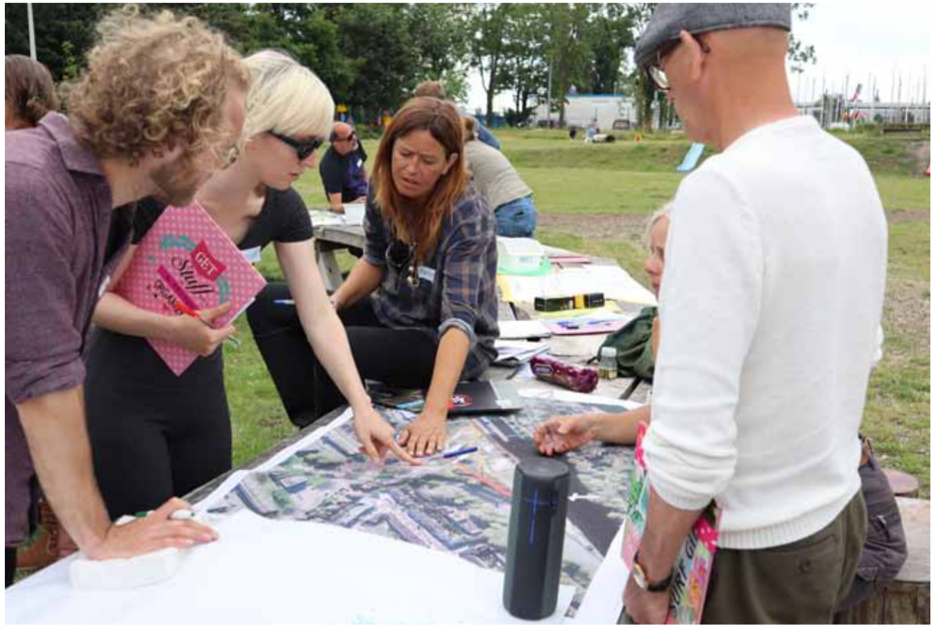
De startbijeenkomst op 2 juli in Sixhaven.