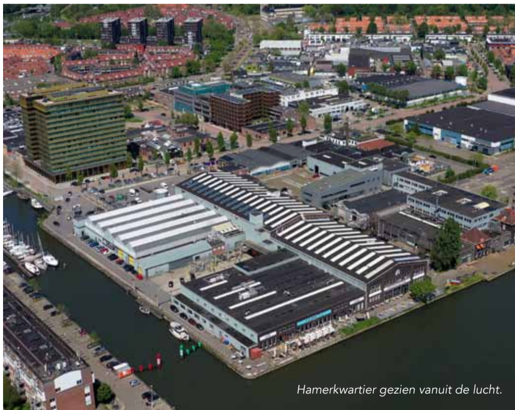
Hamerkwartier gezien vanuit de lucht.

Eindelijk, er komen rondleidingen door Hamerkwartier. Speciaal voor Noorderlingen uit de Vogel- en IJpleinbuurt en Vogeldorp, voor de bedrijven die er nu zitten, en voor de mensen die werken aan de plannen voor dit gebied.