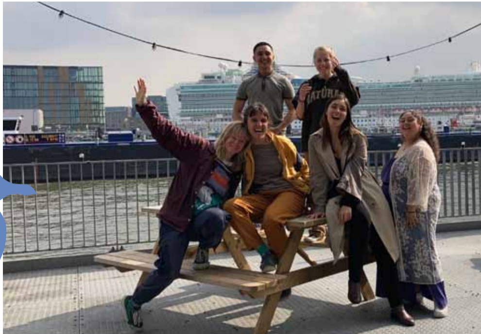
Een aantal jongeren die meedoen aan het kunstproject van MooiMakers. MooiMakers is een samenwerking tussen de gemeente Amsterdam, stichting Makers aan het IJ en jongerenorganisatie DOCK. 5.1, 2, e zit vooraan, tweede van rechts.