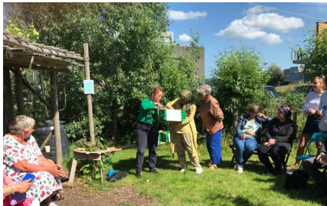
Stadsdeelbestuurder 5.1, 2, e biedt de 50.000e portie groente aan. 5.1, 2, e van de voedselbank in onze wijk neemt deze aan.