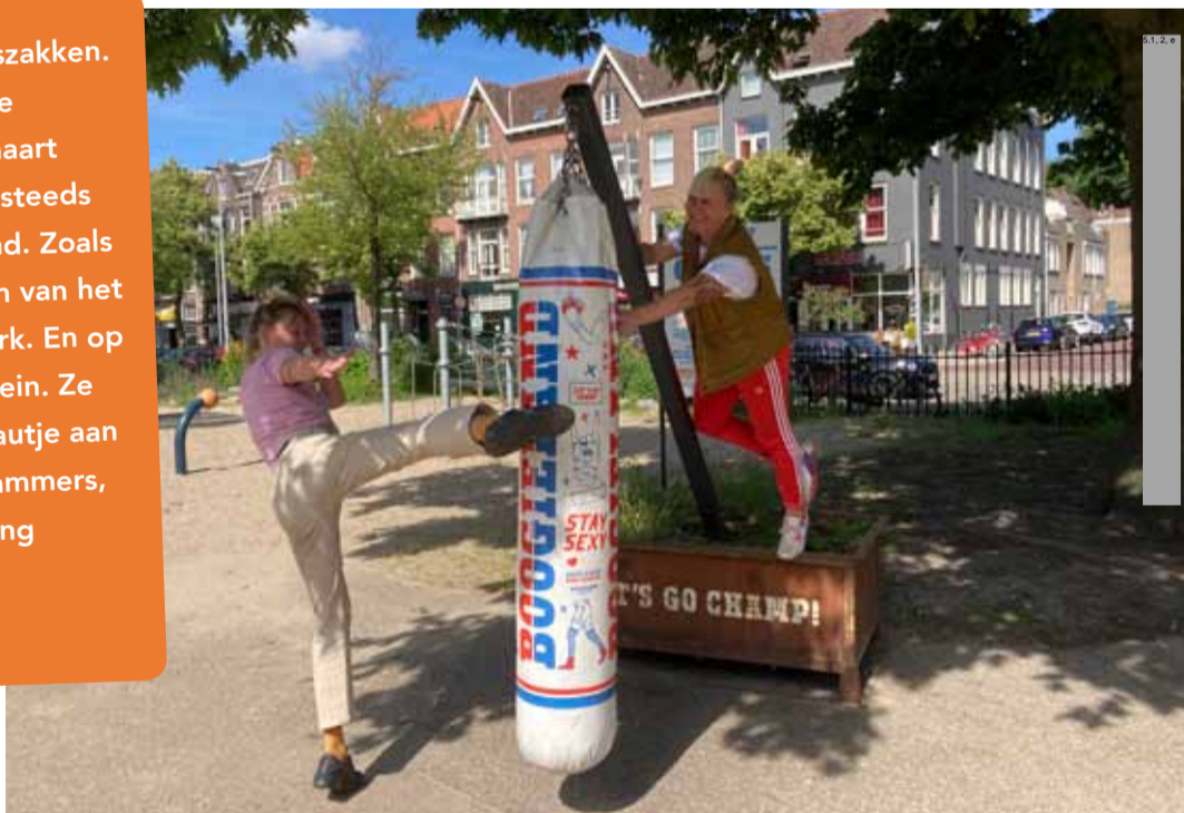
5.1, 2, e (rechts) met haar collega 5.1, 2, e in het Spreeuwenpark.

Kleurrijke bokszakken. Sinds de eerste lockdown in maart 2020 zie je er steeds meer in de stad. Zoals in de speeltuin van het Spreeuwenpark. En op het Zwanenplein. Ze zijn een cadeautje aan alle Amsterdammers, van de stichting Boogieland Foundation.