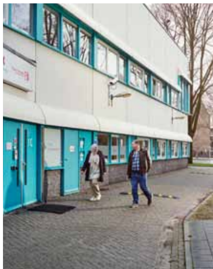
Het kantoor van het buurtteam aan het 5.1, 2, e