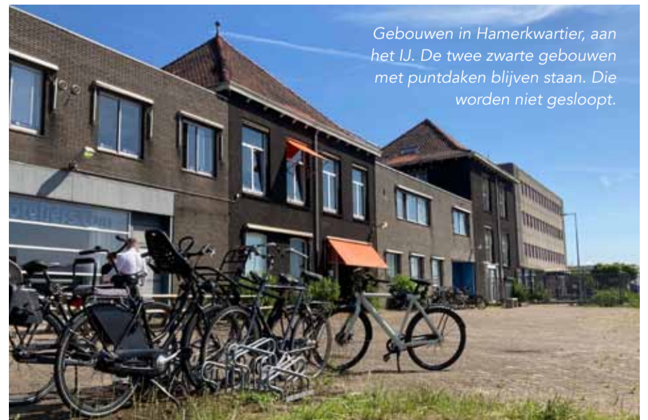
Gebouwen in Hamerkwartier, aan het IJ. De twee zwarte gebouwen met puntaken blijven staan. Die worden niet gesloopt.

U vindt de video over Hamerkwartier op de website www.eigenhaard.nl/projecten/hamerkwartier .