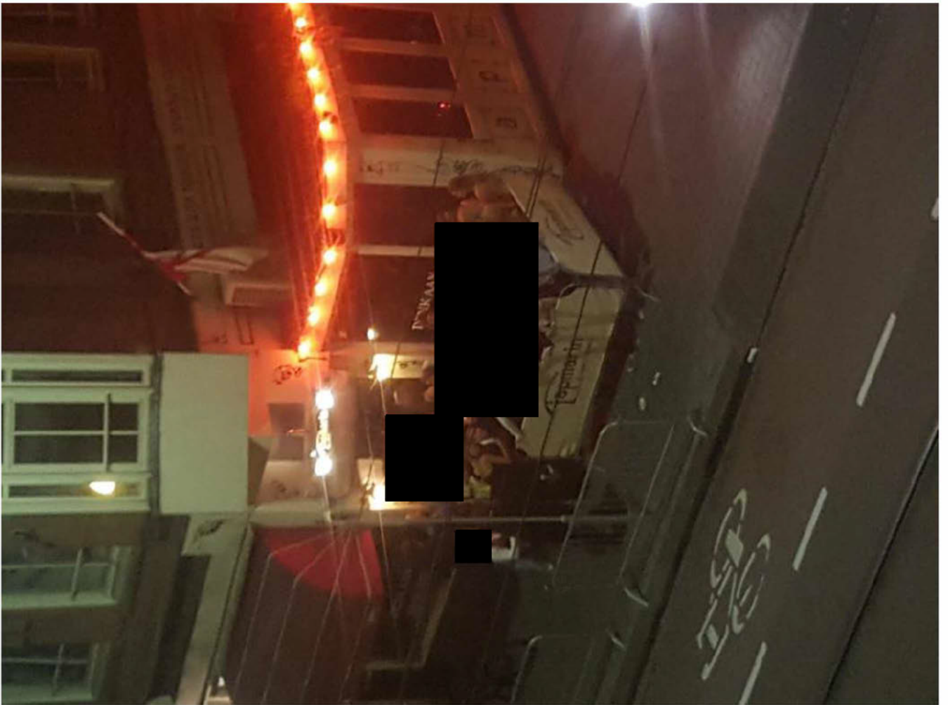
20230831_001256.jpg op 01-09-2023 18:14 door melder