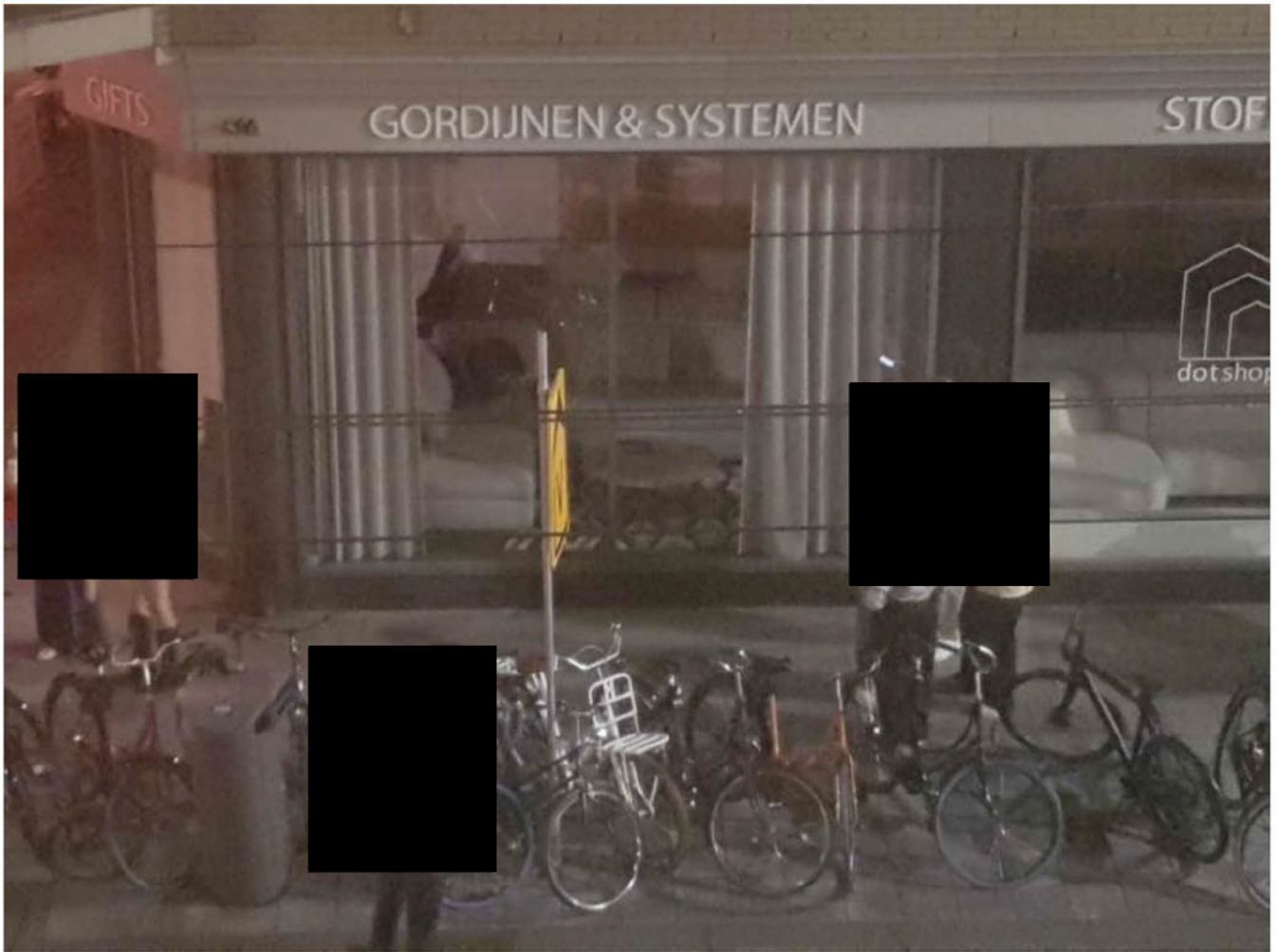
20230831_010010.jpg op 01-09-2023 18:14 door melder