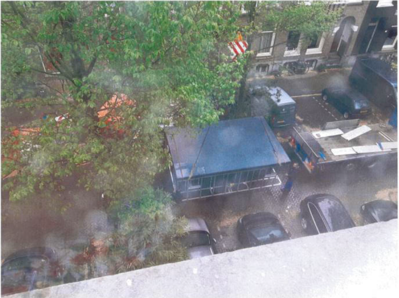
zogenaamde_jacuzzi.jpg op 17-05-2022 14:29 door melder