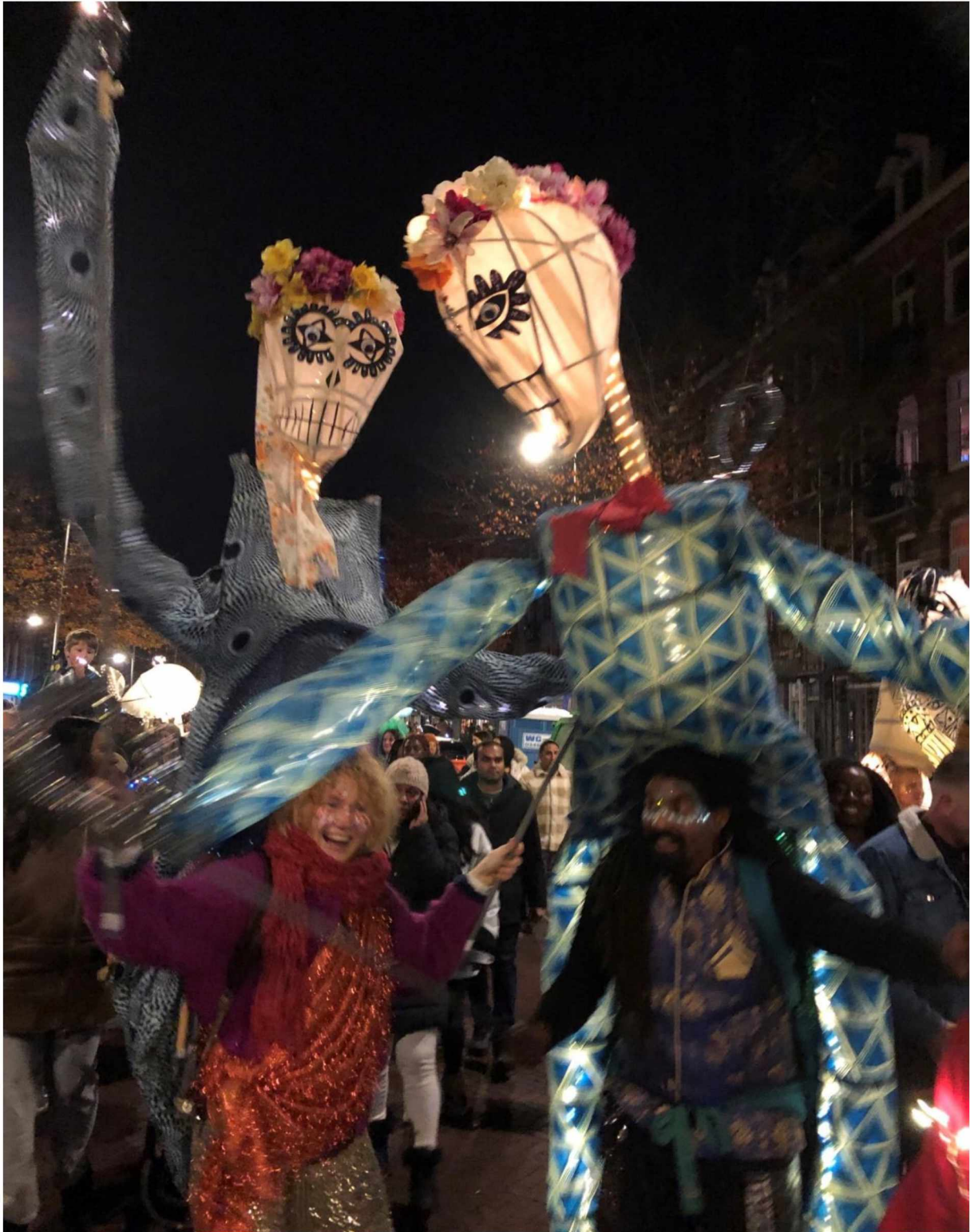
Gebiedsopgave Indische Buurt, Oostelijk Havengebied 2023-2026