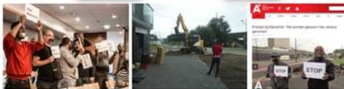
Zomer 2016, en nu dan toch een LaadLos aan achterzijde Flat Klieverink