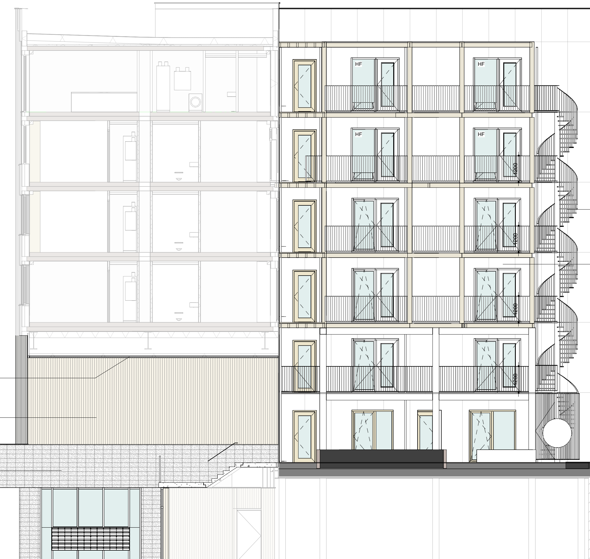
Gevel - Zuidwest schaal 1:200

s = put voorzien van screen / zonwering of opgegeven bouwtechnisch adviseur r = akoestisch dempend rooster t.b.v. spuiventilatie of opgegeven akoestisch adviseur hf = harthoutfenster (dubbel kozijn t.b.v. akoestisch gedempte spuiventilatie) g = nestkast gierzwaluw n.b. = plaatsverdeling volkam bepaling kan afwijken van getoonde verdeling onder invloed van de beschikbaarheid en verwerking hergebruikte platen