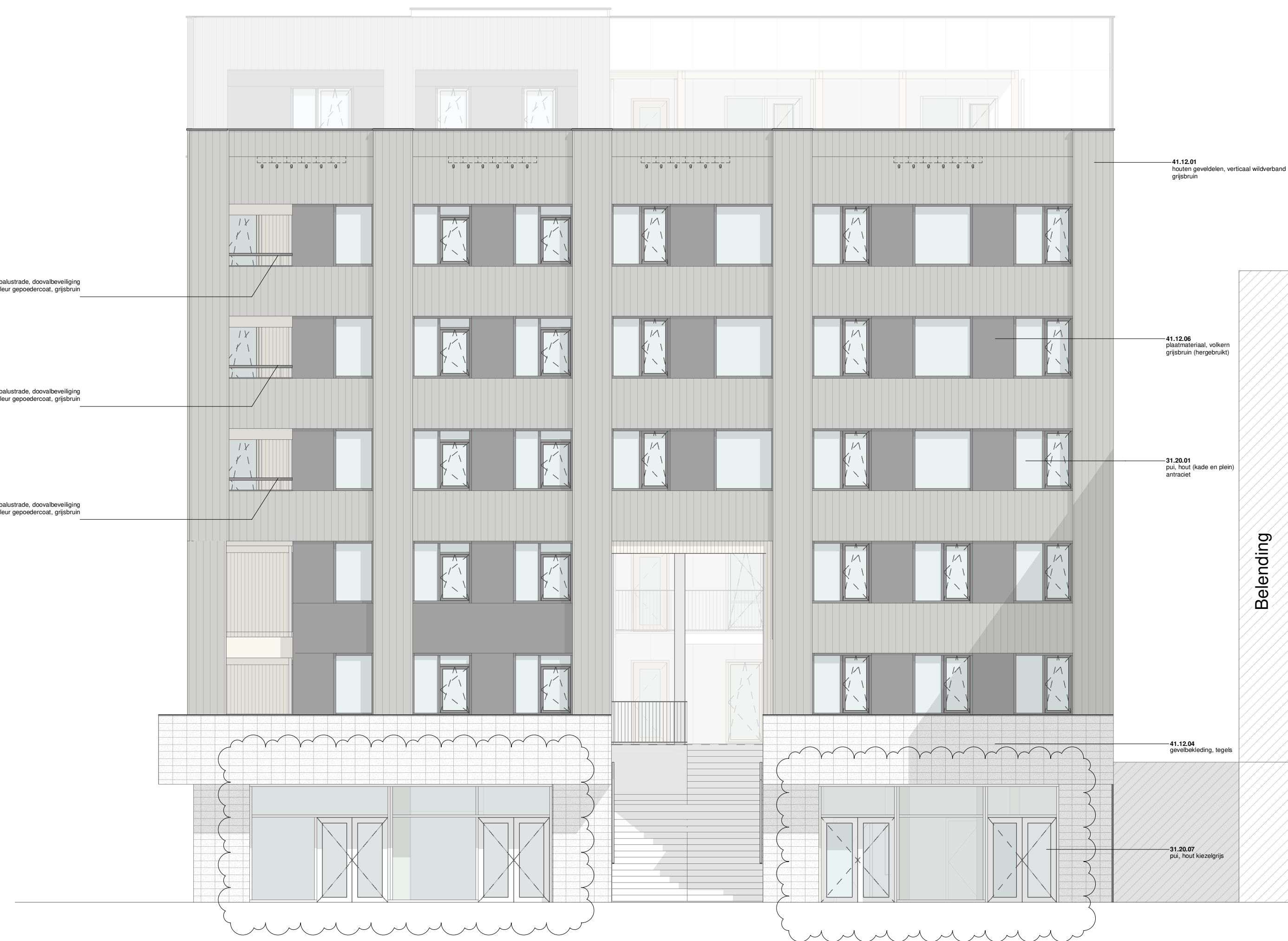
Gevel - Noordwest aanzicht schaal 1:200

s = pui voorzien van screen / zonwering of opgegeven bouwfysisch adviseur r = akoestisch dempend rooster t.b.v. spuiventilatie of opgegeven akoestisch adviseur hf = harbourfenster (dubbel kozijn t.b.v. akoestisch gedempte spuiventilatie) g = nestkast gierzak n.b. = plaatverdeling volgens bepalend kan afwijken van getoonde verdeling onder invloed van de beschikbaarheid en verwerking hergebruikte platen