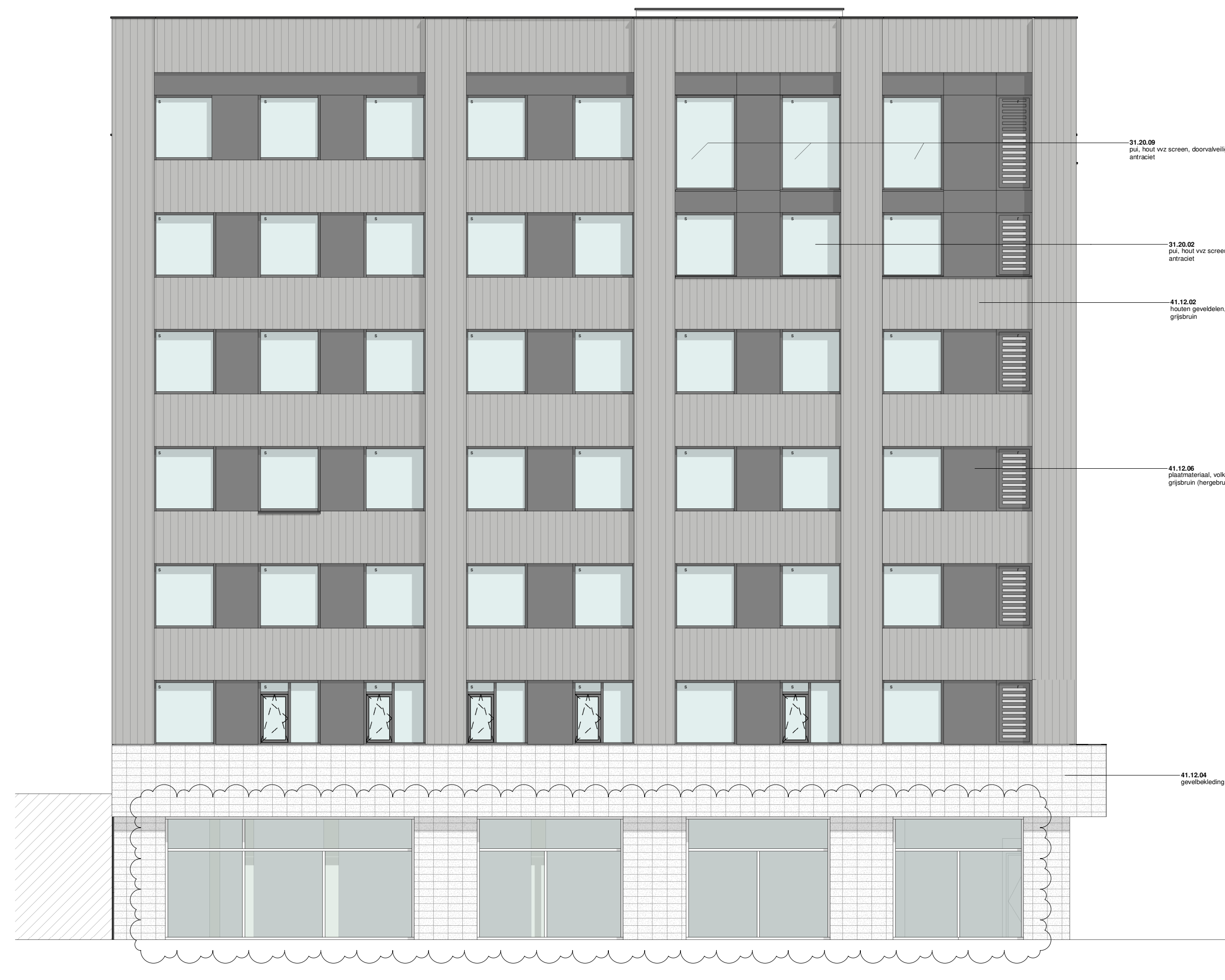
Gevel - Zuidoost aanzicht schaal 1:200

s = pui voorzien van screen / zonwering of opgegeven bouwfysisch adviseur r = akoestisch dempend rooster t.b.v. spuiventilatie of opgegeven akoestisch adviseur hf = harbourfenster (dubbel kozijn t.b.v. akoestisch gedempte spuiventilatie) g = nestkast gierzak n.b. = plaatverdeling volgens bepalend kan afwijken van getoonde verdeling onder invloed van de beschikbaarheid en verwerking hergebruikte platen