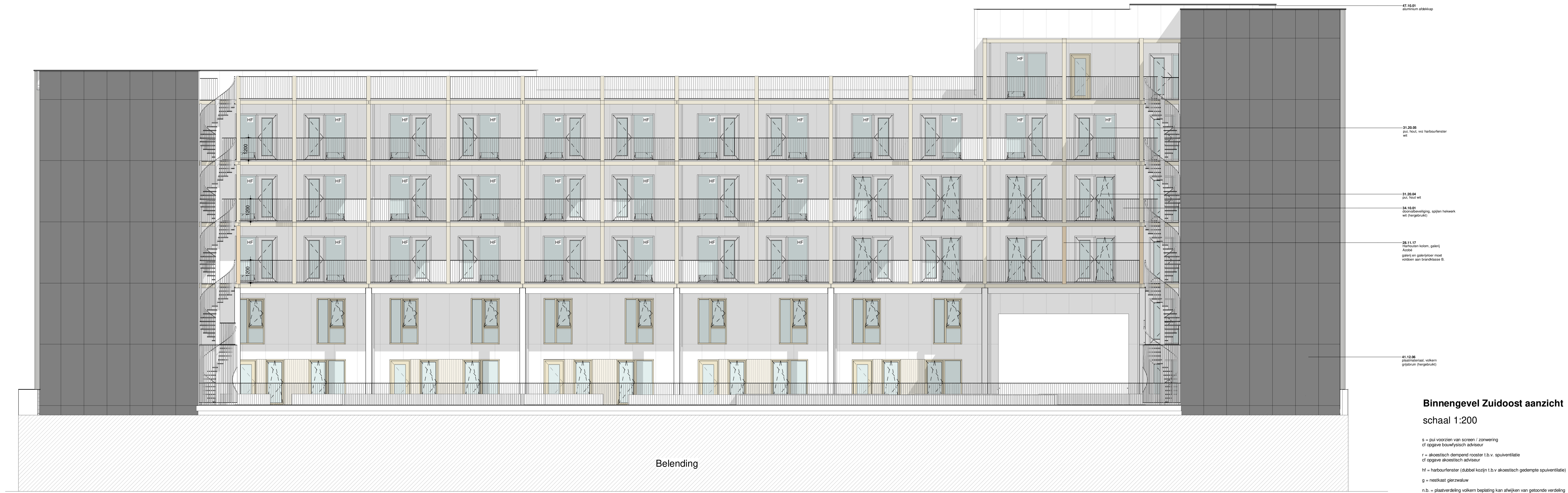
Binnengevel Zuidoost aanzicht schaal 1:200

s = put voorzien van screen / zonwering of opgegeven bouwtechnisch adviseur r = akoestisch dempend rooster t.b.v. spuiventilatie of opgegeven akoestisch adviseur hf = harthoutfenster (dubbel kozijn t.b.v. akoestisch gedempte spuiventilatie) g = nestkast gierzwaluw n.b. = plaatsverdeling volkam bepaling kan afwijken van getoonde verdeling onder invloed van de beschikbaarheid en verwerking hergebruikte platen