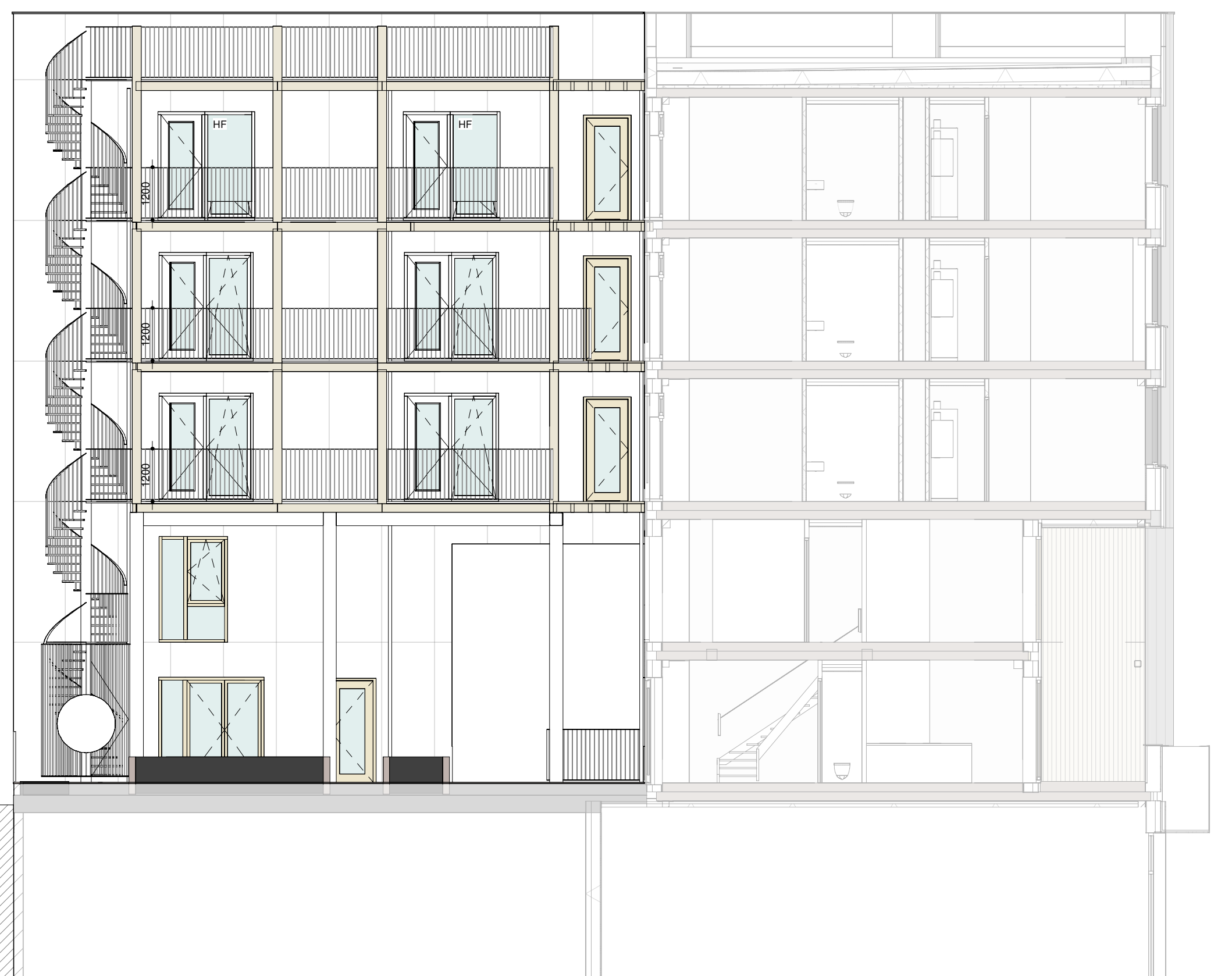
Binnengevel Noordwest aanzicht schaal 1:200

s = put voorzien van screen / zonwering of opgegeven bouwtechnisch adviseur r = akoestisch dempend rooster t.b.v. spuiventilatie of opgegeven akoestisch adviseur hf = harthoutfenster (dubbel kozijn t.b.v. akoestisch gedempte spuiventilatie) g = nestkast gierzwaluw n.b. = plaatsverdeling volkam bepaling kan afwijken van getoonde verdeling onder invloed van de beschikbaarheid en verwerking hergebruikte platen