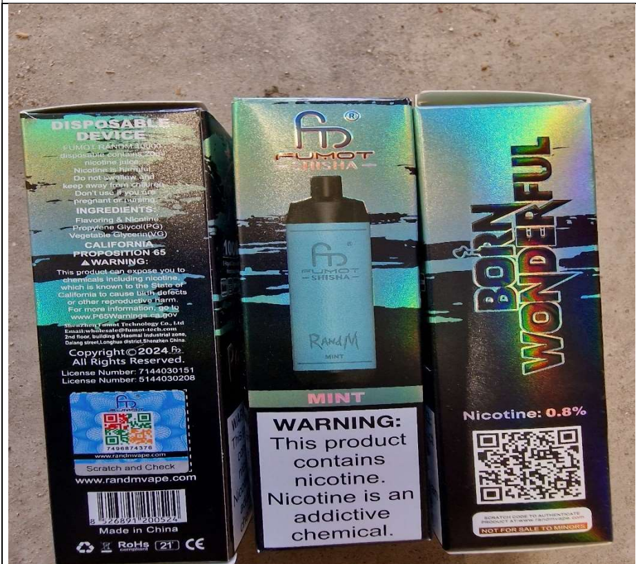
5. Randm Fumot Shisha smaak "mint"