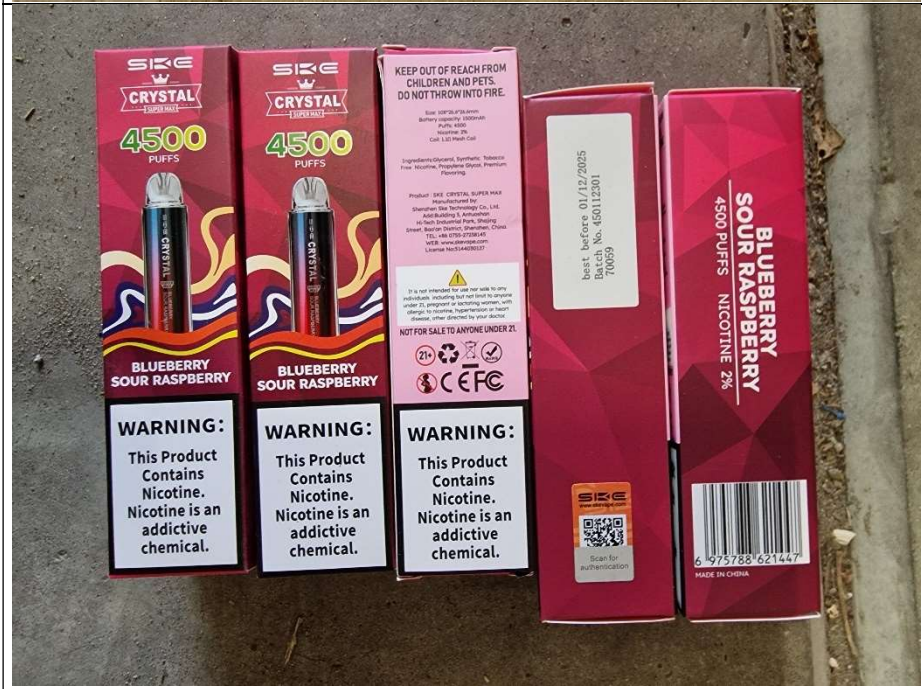
4. SKE crystal 4500 Blueberry sour raspberry