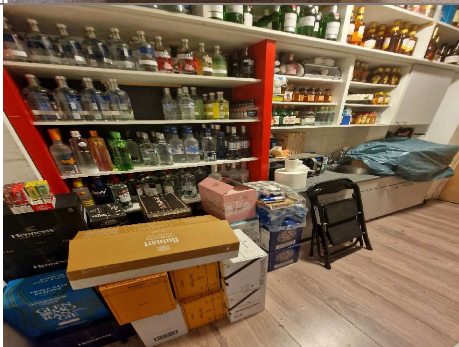
7. Overzicht keuken met zeil op het aanrecht