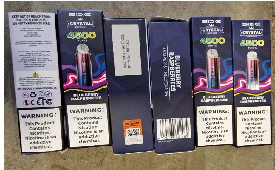
3. Crystal 4500 Smaak blueberry raspberries