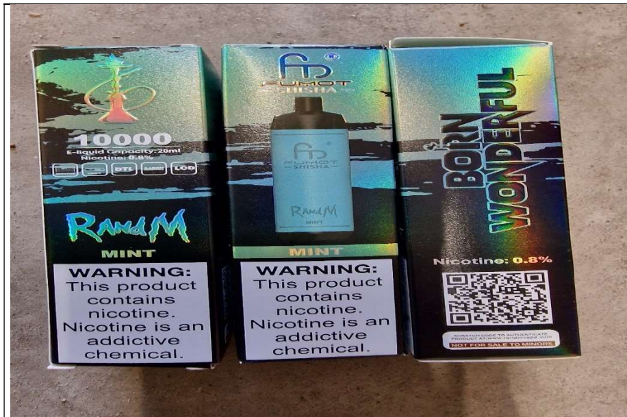
6. Randm Fumot Shisha mint 0.8 % nicotine E-liquid capacity 20 ml