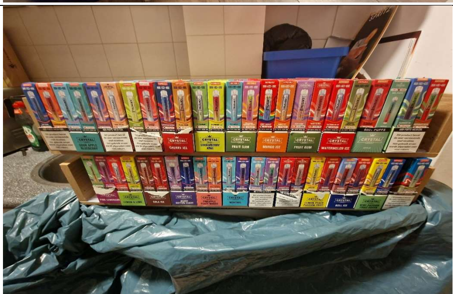
8. Elektronische sigaretten in verschillende smaken in de keuken van de slijterij in een lade