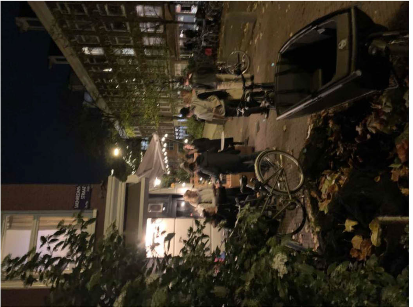
483A160A-2033-4764-A447-43458E16973C.jpeg op 17-11-2022 21:20 door melder