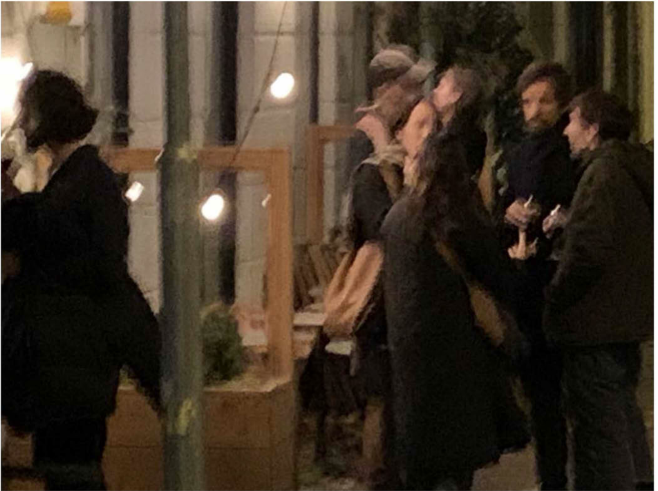
817B427A-B3C9-4FD7-8DA8-DAAE2827FA1B.jpeg op 17-11-2022 21:20 door melder