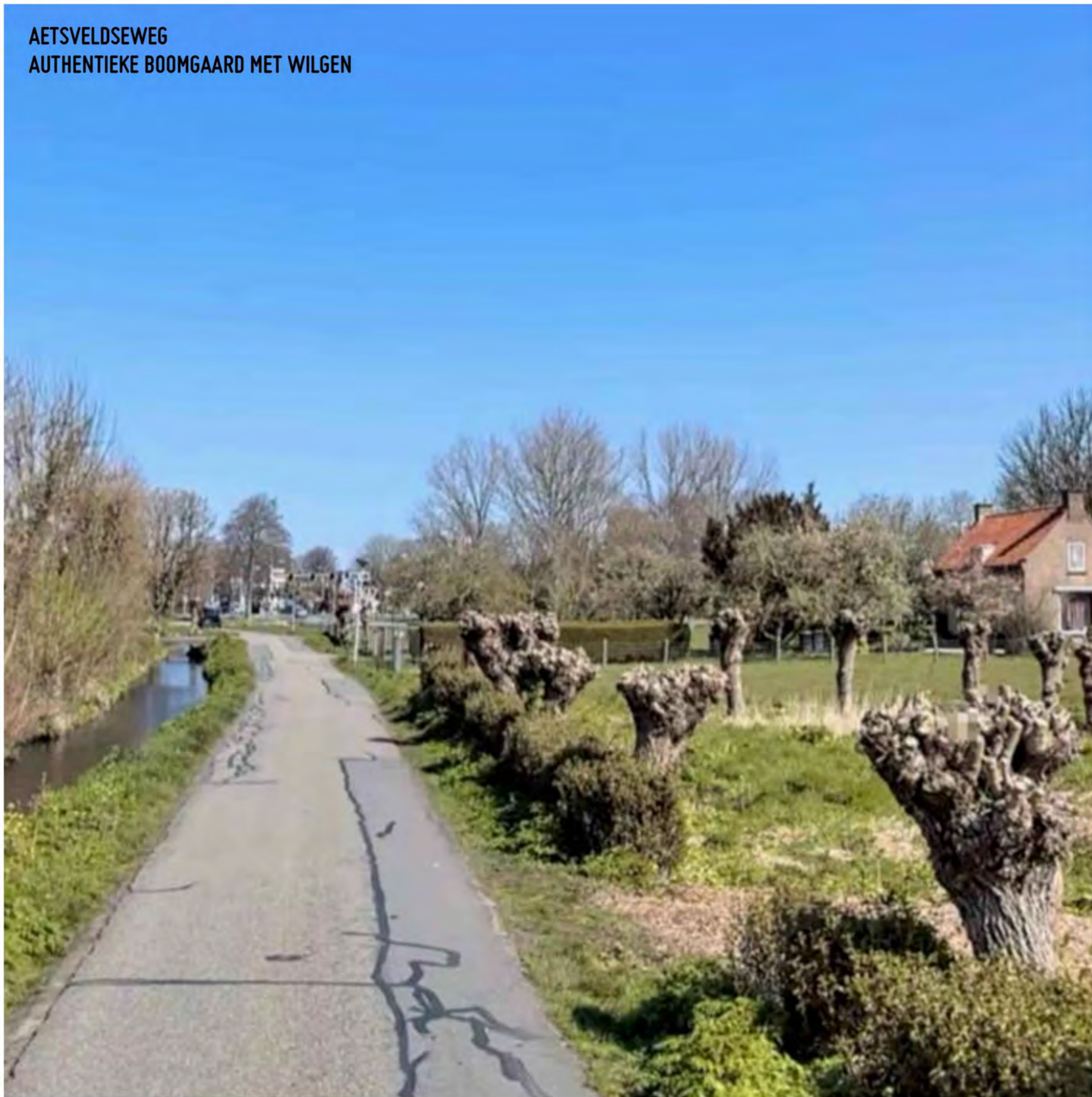
AETSVELDSEWEG AUTHENTIEKE BOOMGAARD MET WILGEN