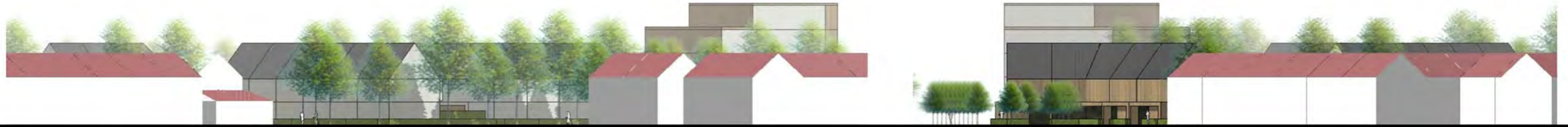
G.J. Wiefferingdreef / Waardijkstraat