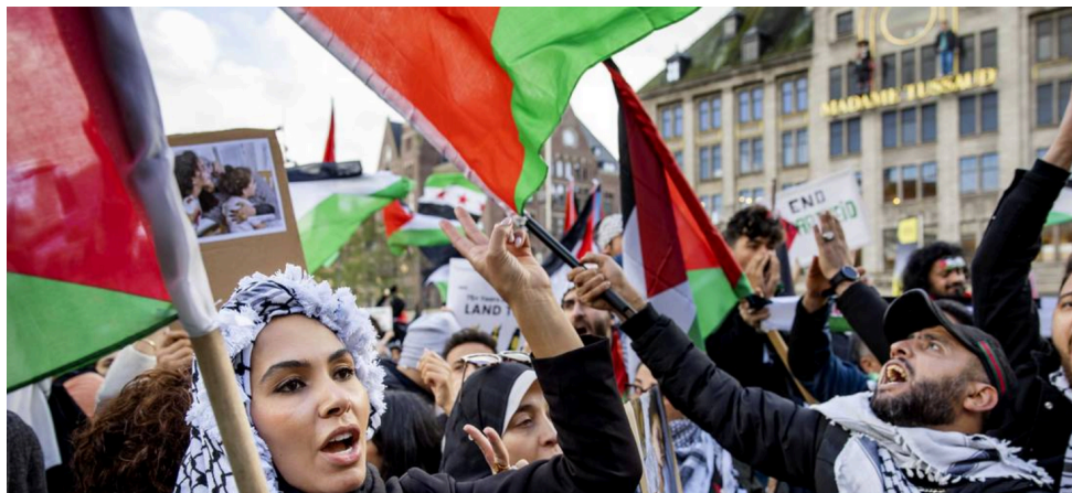
De gevolgen van de oorlog tussen Israël en Hamas zijn ook in Amsterdam merkbaar.