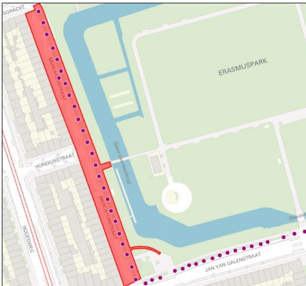
Afb. 1: 24 platanen waarvan de beschermde status wordt ingetrokken. Deze bomenrij krijgt bescherming via de Hoofdbomenstructuur. In het adviesrapport staat deze rij als 1 boompunt opgenomen.