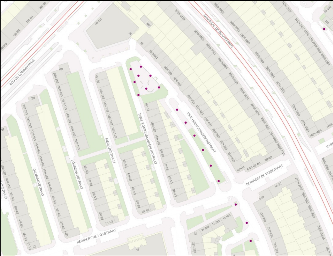
Afb. 2: 17 platanen in de Vier Heemskinderenstraat die geen beschermde status krijgen. In het adviesrapport staat deze groep als 1 boompunt opgenomen.