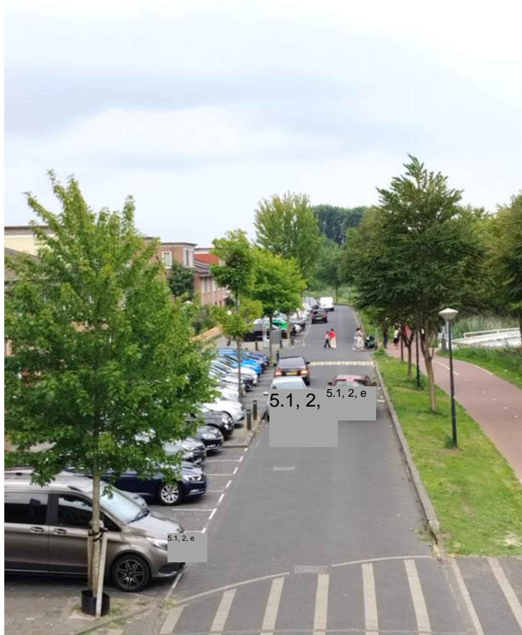
IMG_20250726_201658.jpg op 26-07-2025 20:41 door melder