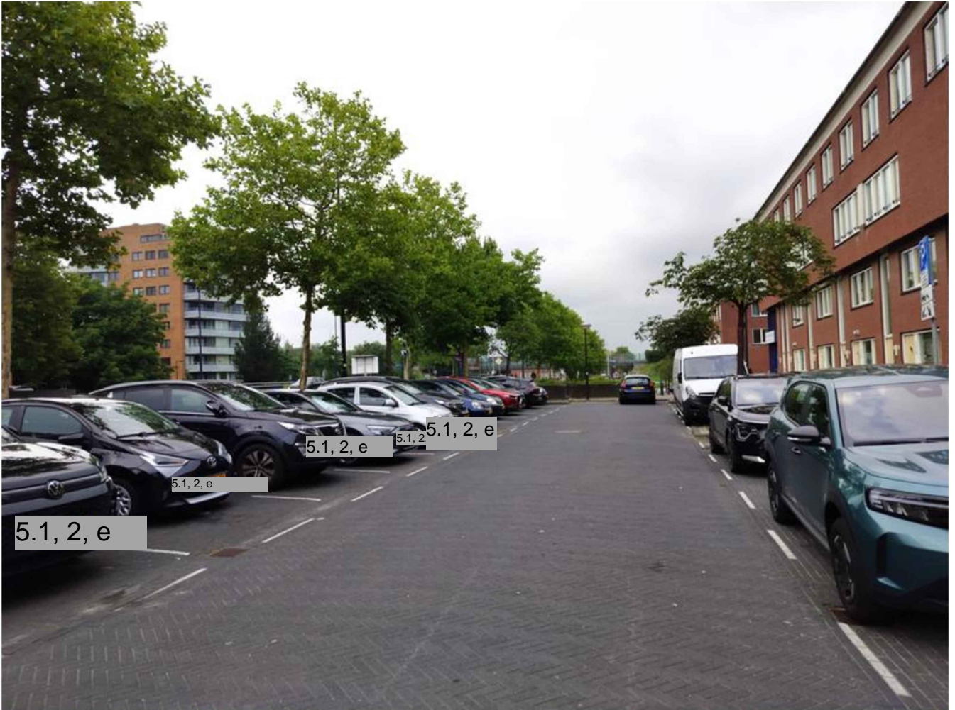
IMG_20250726_201814.jpg op 26-07-2025 20:41 door melder