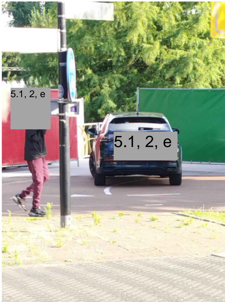
IMG_20250725_184112.jpg op 25-07-2025 19:32 door melder