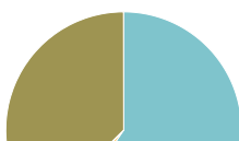
MPG - MilieuPrestatie Gebouw €/m 2 /a - Levenscyclusst