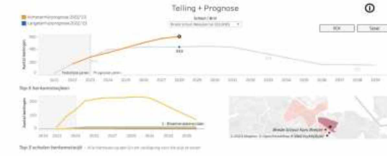
Brede school Weesperrijk