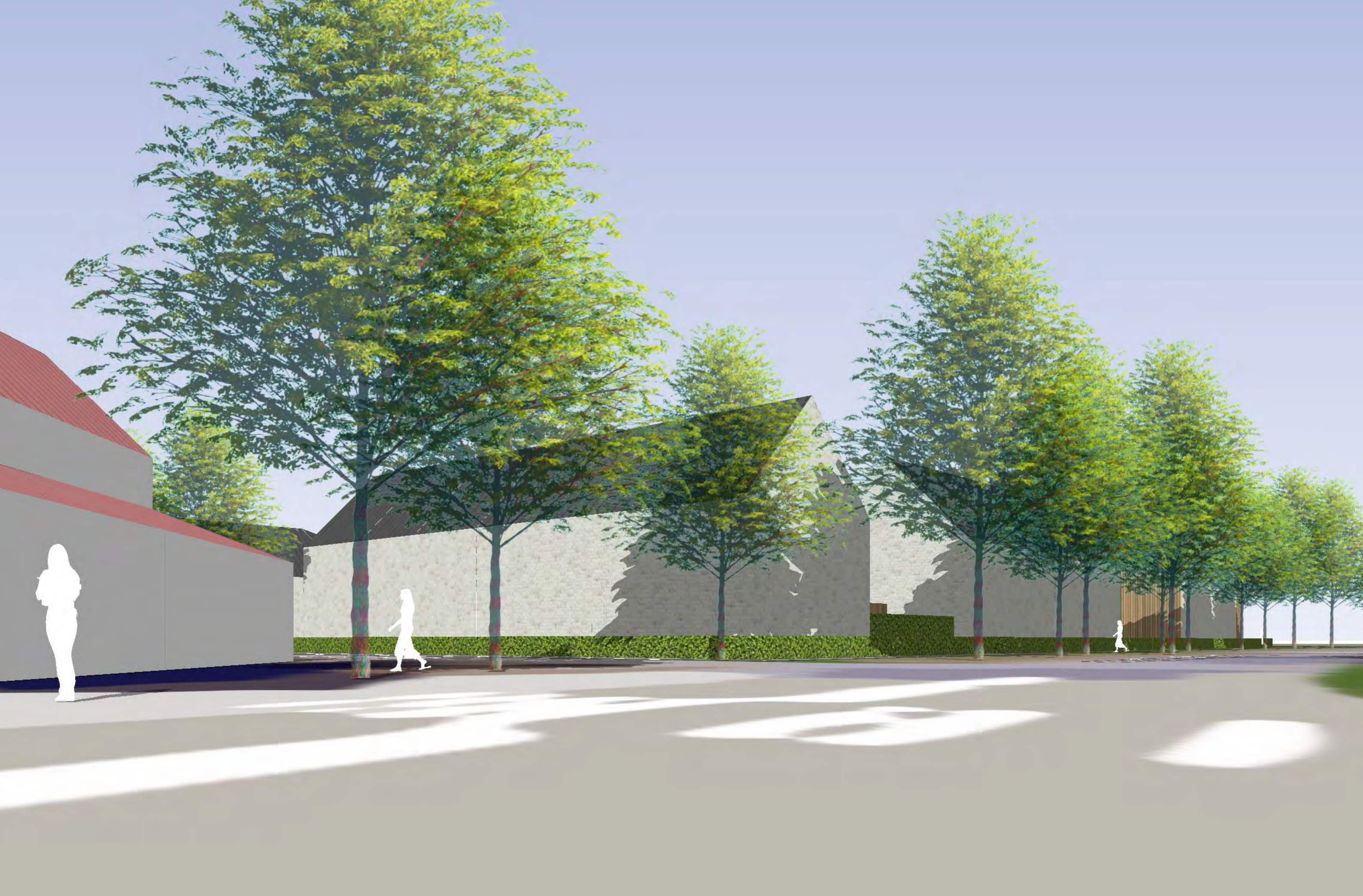
G.J. Wiefferingdreef / Waardijntraat