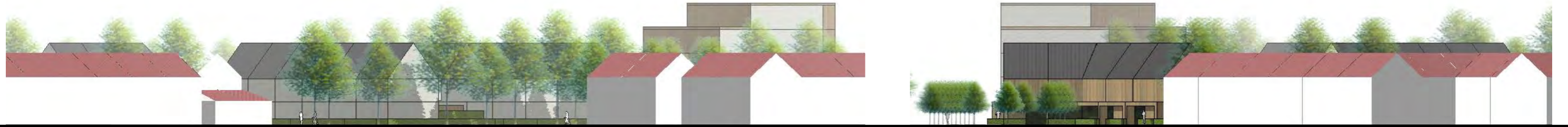
G.J. Wiefferingdreef / Waardijkstraat