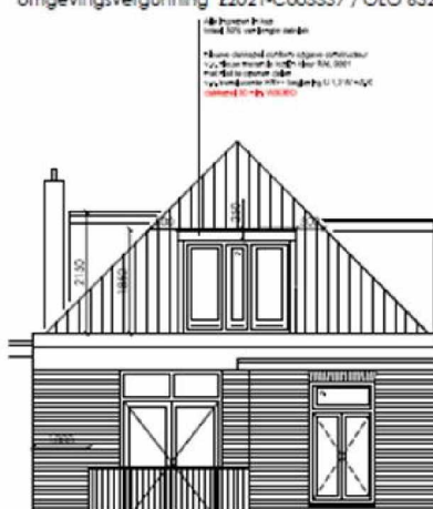
omgevingsvergunning Z2021-C005537 / OLO 6329001

De aangepaste dakkapel is duidelijk hoger en smaller dan de vergunde dakkapel. Ik heb in de afgelopen week geen mogelijkheid gehad om de afmetingen terplaatse te controleren, maar de non-conformiteit met de omgevingsvergunning is hier al zichtbaar.