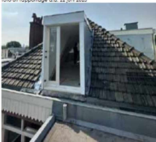
Dakkapel achterzijde verkleind.