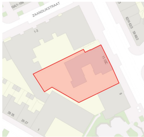
5.1, 2, e