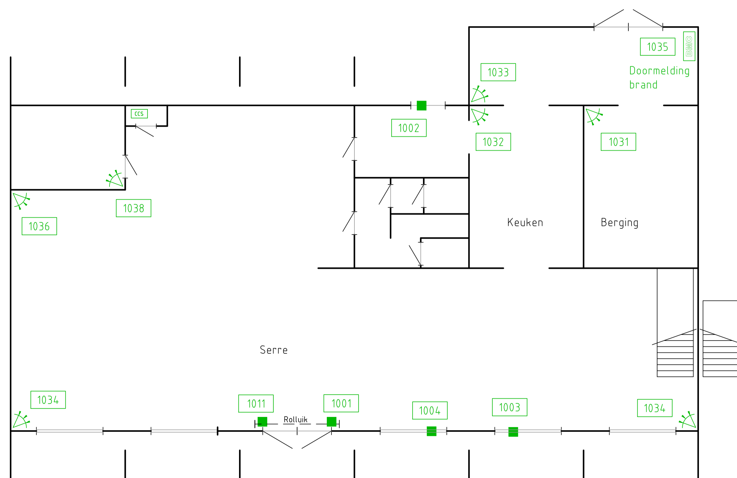
Hoofdgebouw begane grond