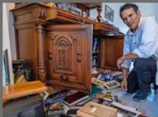
De politie doet met hoge prioriteit onderzoek naar vernieling Joodse Michael Asuss thuis in Amsterdam-Buitenveldert.

Er heeft gisteravond een afschuwelijke inbraak met vernielingen plaatsgevonden in Buitenveldert. Politie was snel ter plaatse en heeft een onderzoek gestart. Dat loopt volop, dus dat moeten we afwachten. Maar het lijkt te gaan om een antisemitische aanval en dat nemen we uiterst serieus. Ik ben vanmorgen bij het slachtoffer op bezoek geweest, een Joods-Israelische man, hij is enorm geschrokken en dat snap ik volkomen. De politie geeft hoge prioriteit aan deze zaak.