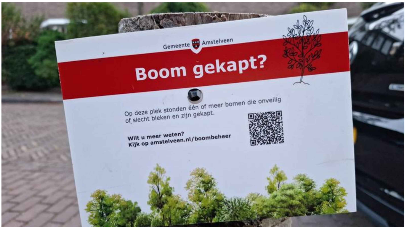
IMG-20240825-WA0011.jpg op 27-08-2024 11:39 door melder