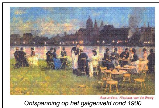
Amsterdam, Nicolaas van der Waay Ontspanning op het galgenveld rond 1900

De waterwegen zijn hierin dus belangrijke elementen, maar ook de openbare wandel- en fietsroutes (landroutes) naar Waterland zijn van belang. De twee groene zones aan weerszijden van het Noordhollandsch Kanaal zijn de uitloopgebieden voor de tuindorpen en het centrumgebied tussen het IJ en de Waterlandse Zeedijk. Als de werkzaamheden voor de Noord/Zuidlijn in 2013 zijn afgerond, moet de route naar Waterland worden verbeterd, waardoor de verbinding veel eenduidiger wordt. Het werkterrein kan dan worden omgevormd tot een stedelijk park met een landschappelijk karakter, zodat het binnen een groter landschap wordt geplaatst. De bomenlaan langs het kanaal kan worden teruggebracht.