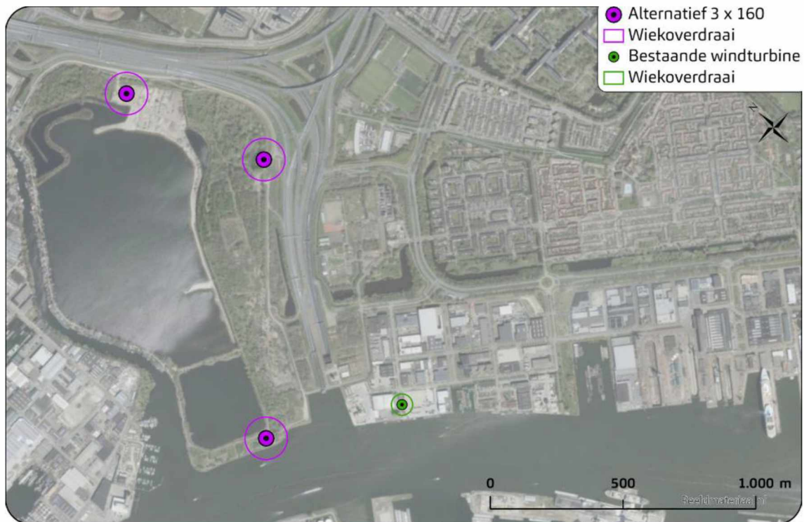
Afbeelding 1: Voorstel voorlopig voorkeursalternatief