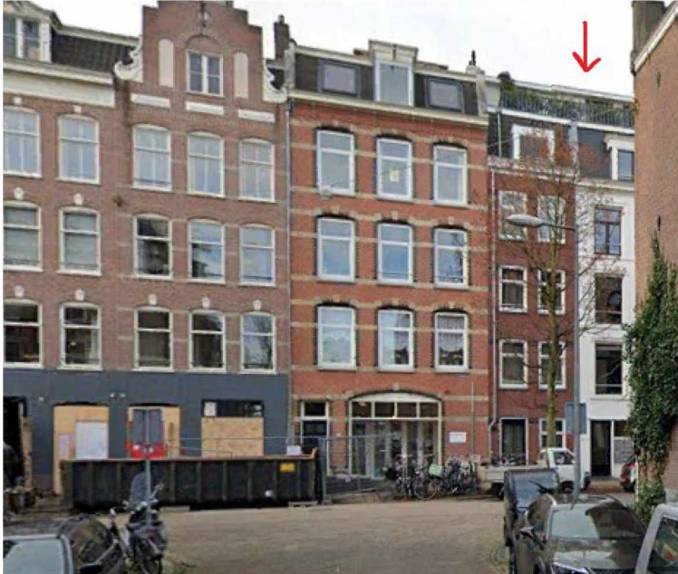
Foto van het pand met dakopbouw aan de 5.1.2.e

De dakopbouw op 5.1.2.e manifesteert zich veel minder in het gevelbeeld, waardoor de impact op het stadsbeeld beperkt is.