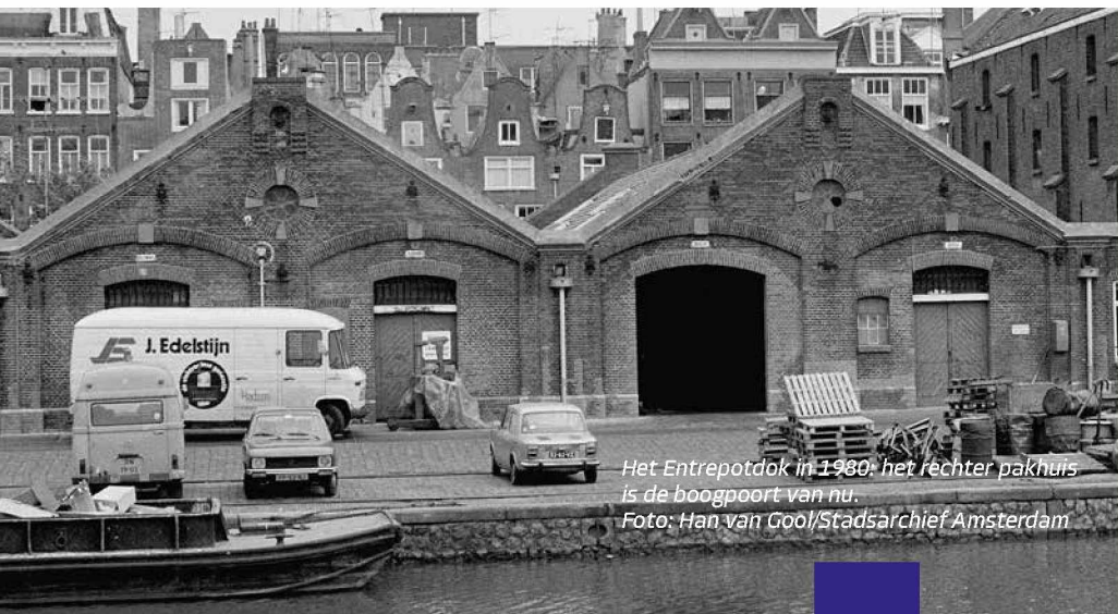
Het Entrepotdok in 1980: het rechter pakhuis is de boogpoort van nu.