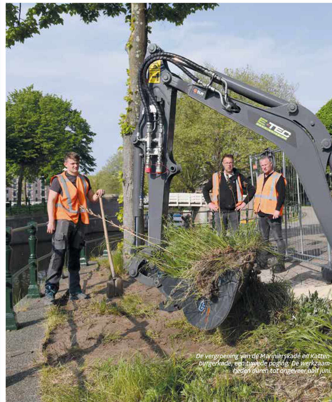
De vergroening van de Marinierskade en Kattenburgerkade, een tweede poging. De werkzaamheden duren tot ongeveer half juni.

5.1.2.e Het groene gebied is naar verwachting klaar in 2030. We willen graag dat het spoorpark toegankelijk wordt voor iedereen. Omdat dit het laatste onderdeel van het plan is dat wordt uitgevoerd, wordt hier pas over een paar jaar een besluit over genomen. Dit is ook de reden dat hier op een later moment, dicht bij de start van uitvoering, geld voor beschikbaar kan worden gesteld. In de gesprekken hierover, ook met ProRail, nemen we mee dat de behoefte van uit de buurt voor openbaar groen groot is.