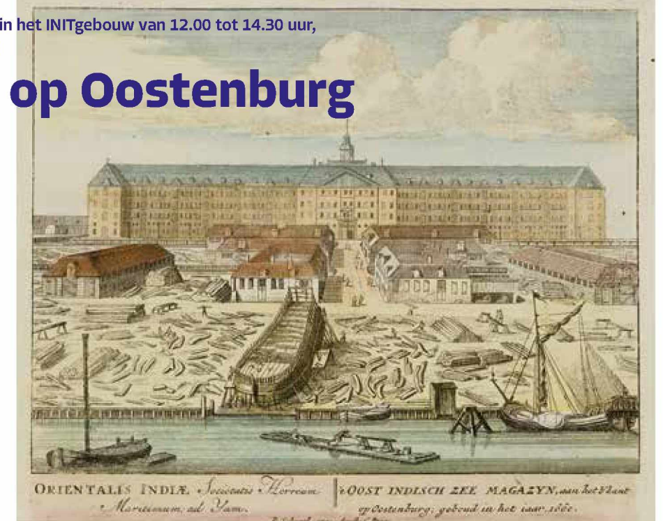
Scheepswerf op Oostenburg, ca. 1710.

Op verschillende momenten in haar bijna tweehonderdjarig bestaan bouwde de VOC ook schepen die specifiek bestemd waren voor de handel in mensen, de zogenaamde