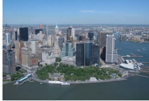
Battery Park, New York

Geachte dames en heren vers gekozen volksvertegenwoordigers,