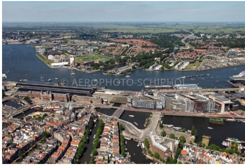
Voortuin van Noord, Amsterdam

aan: alle verkozen politici van centrale stad Amsterdam en Amsterdam Noord betreft: de ontwikkeling Sixhaven gebied en omstreken afzender: platform TOLHUIS/SIXHAVEN-gebied, de 'voortuin van Noord'