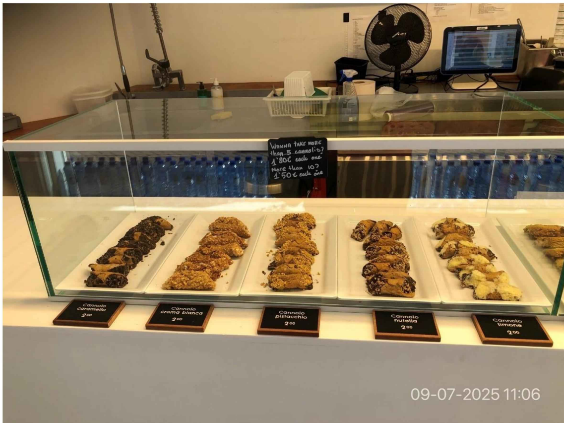
10. In de vitrine op de toonbank o.a diverse soorten cannolo.