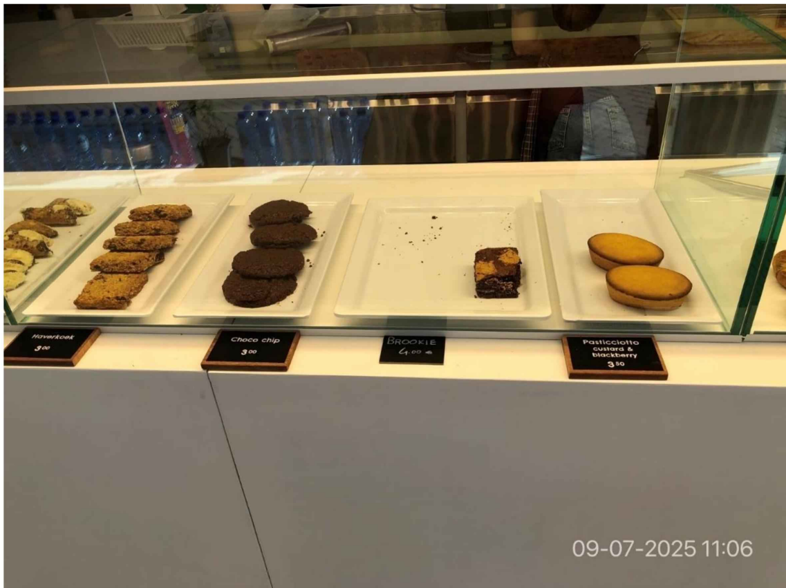
11. Vervolg vitrine met diverse soorten koeken.