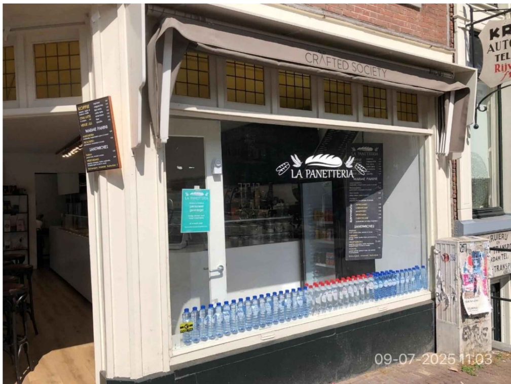
2. Voorgevel Singel. Bij de deur hangt een menubord van ca. A3 formaat. In de etalage staan flessen water. Zo'n 1 meter achter het raam hangt nog een groot menubord. Op het raam hangt een turquoise formulier met 'personeel gezocht'.