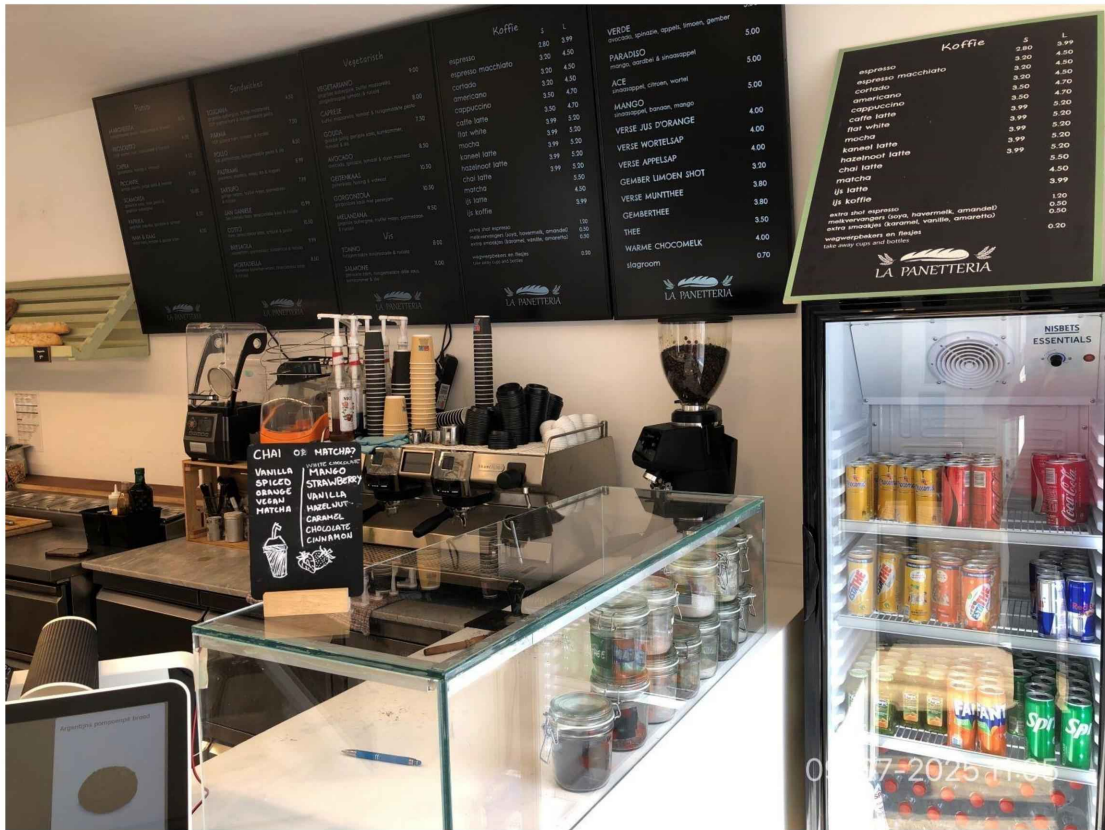
4. Tegen de achterwand hangen 5 menuborden met de rubrieken: panini, sandwiches, vegetarisch, koffie en thee. Op de toonbank staat een klein menubord met diverse soorten chai of matcha.