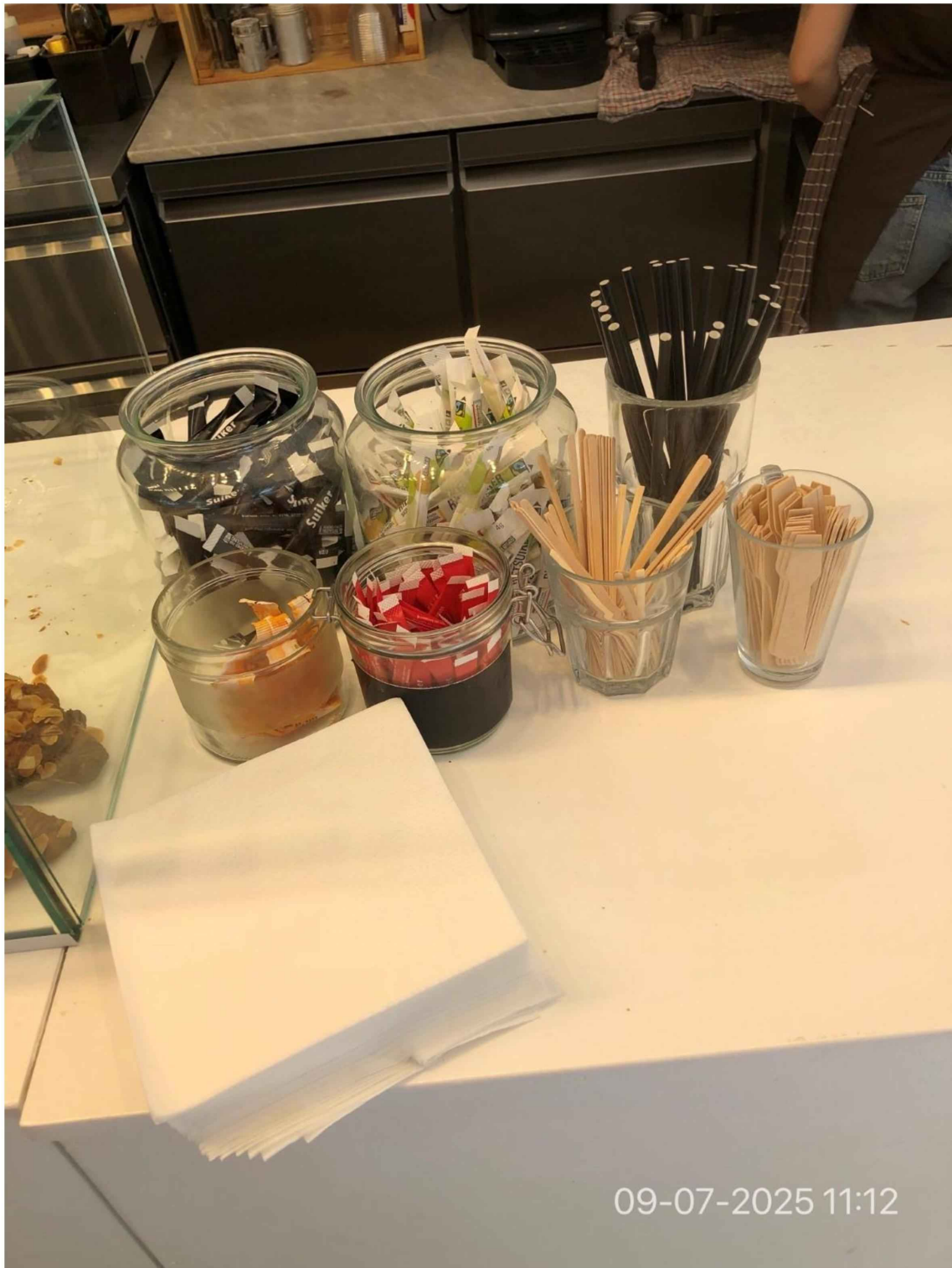
13. Op de toonbank staan potten en glazen met o.a suiker, rietjes, roerstaafjes, lepeltjes etc.