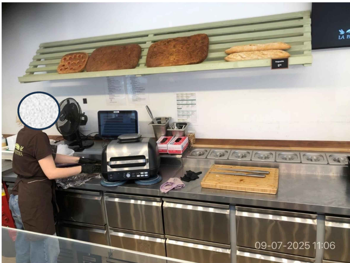
7. Tegen de achterwand is een rek geplaatst waarop foccacia's en stokbroden liggen.