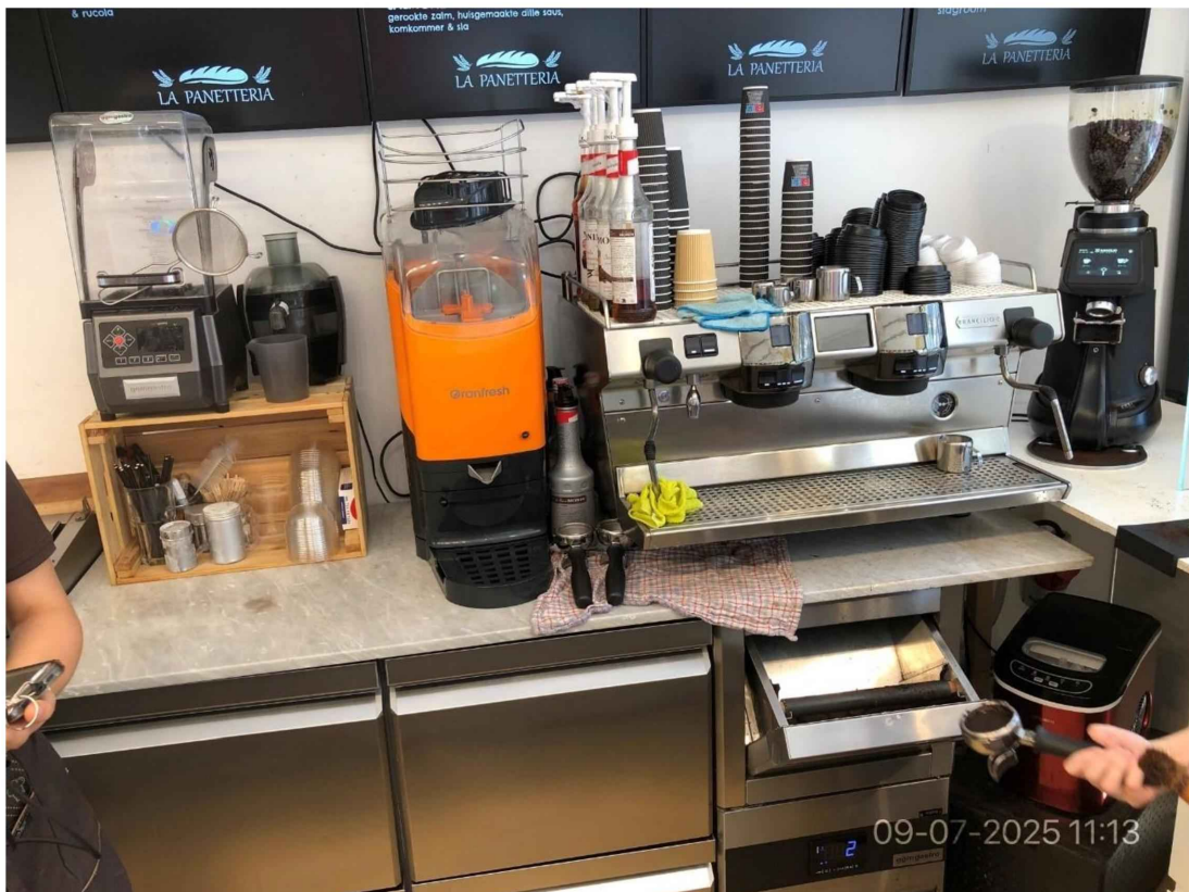
5. Tegen de achterwand staat op een werkblad een koffiemachine met daarop to go bekers en diverse soorten siroop. Verder een koffiebonen maler en andere machines voor sappen etc.