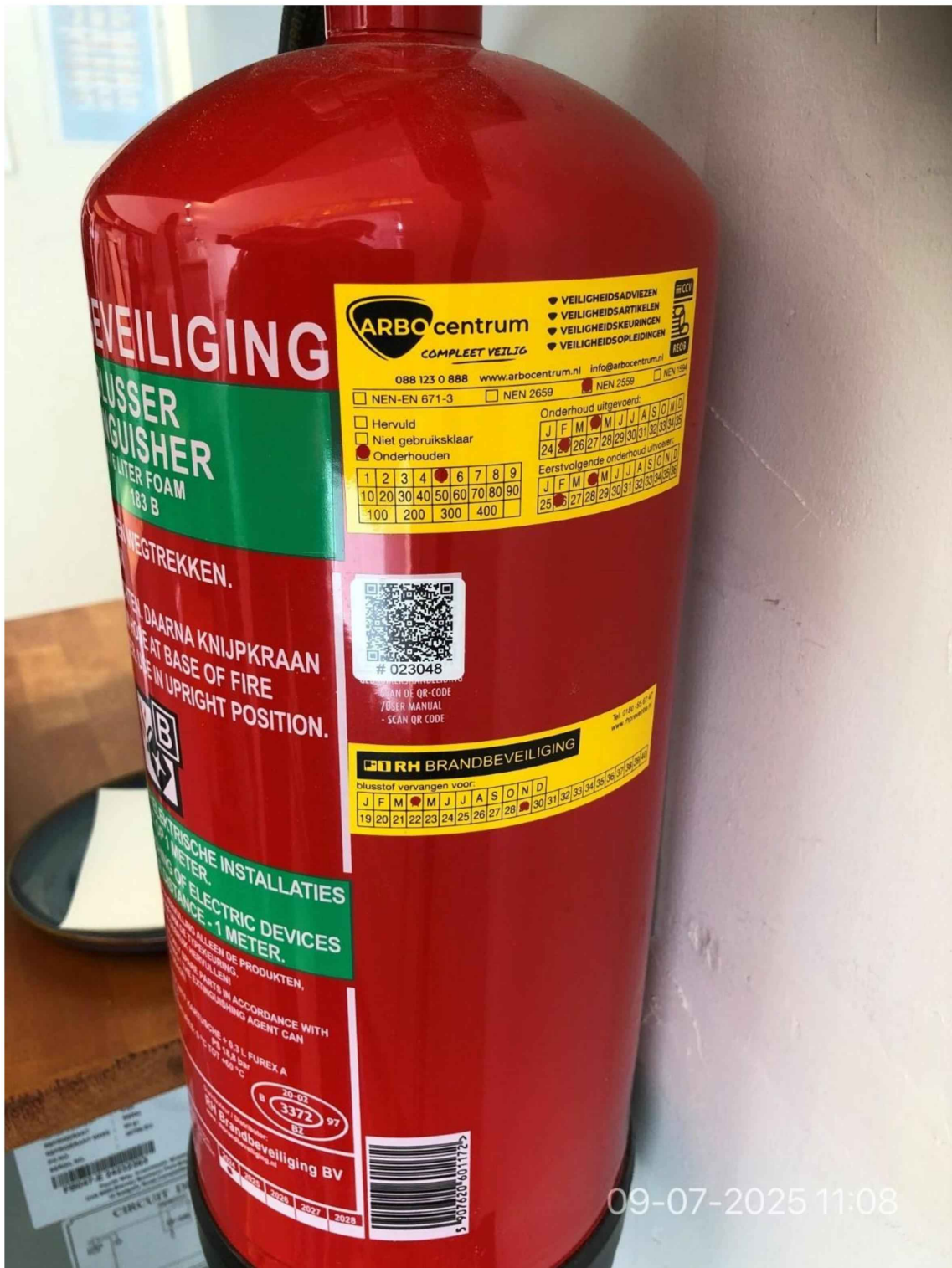
17. Blusmiddel opgehangen en gekeurd, geen pictogram aangebracht.