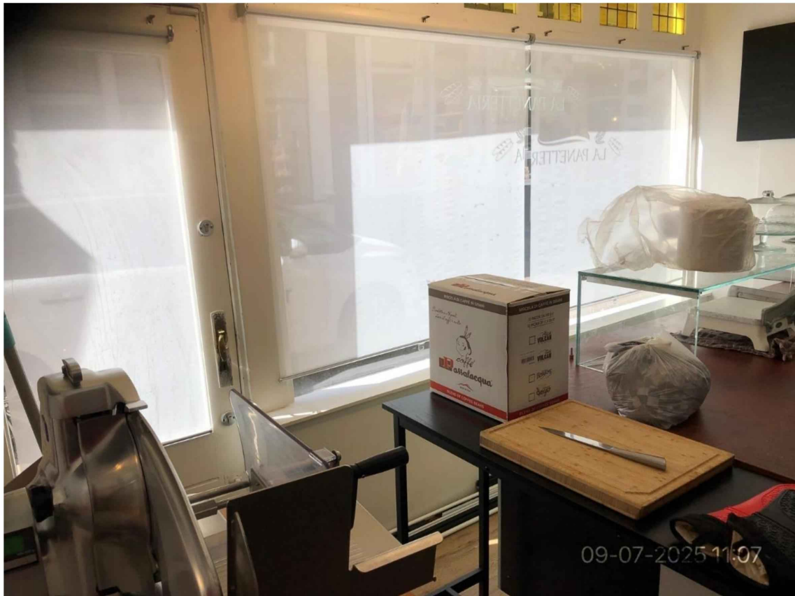
16. Vervolg. Werktafel met snijplank en mes. Rolgordijnen voor de ramen.