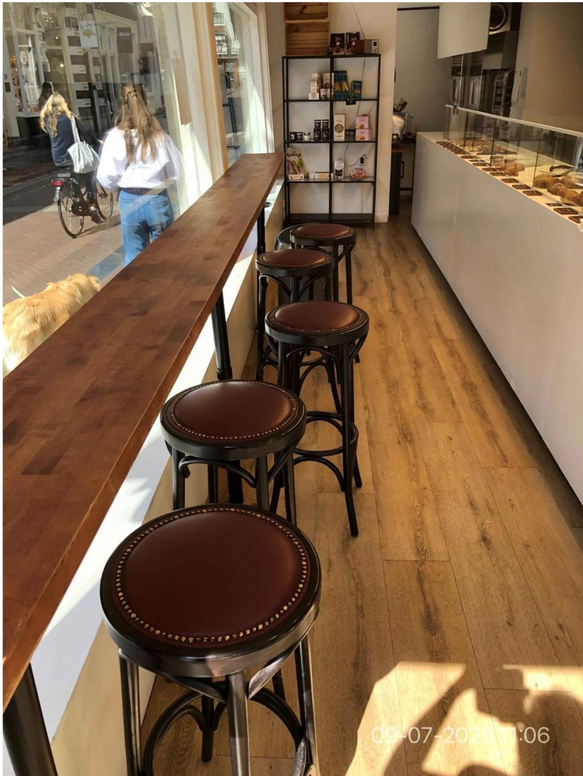
8. Aan de Oude Spiegelstraat zijde is achter het raam een tafel geplaatst met 5 krukken. Achterin staat een kast met diverse Italiaanse etenswaren. Rechts een hoge toonbank met vitrines met etenswaren zoals diverse soorten cannolo, koeken en croissantjes.