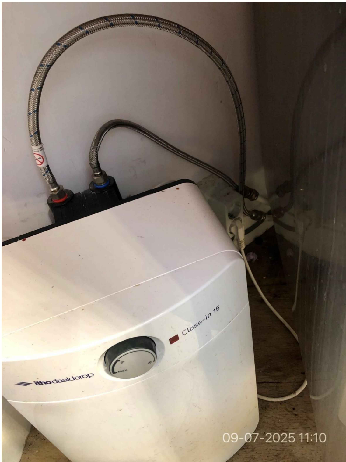
19. Stekkerdozen verwijderd. Wandcontactdozen worden gebruikt.