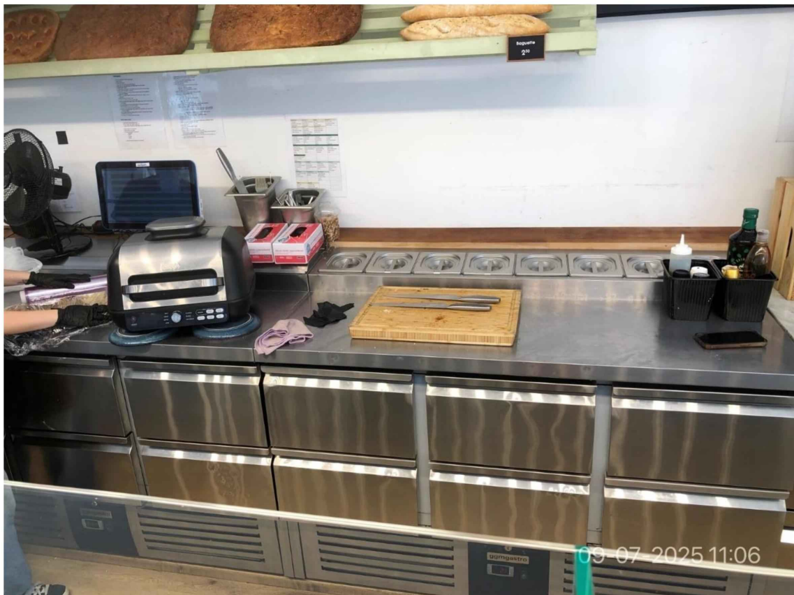
6. Tegen de achterwand zijn koelingen geplaatst. Er zijn 8 metalen bakjes voor etenswaren. Op de werktafel worden producten bereid.