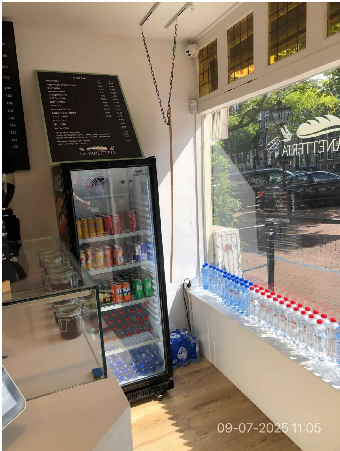
3. Binnen aan de Singelzijde staat vlak achter de etalage een koelkast met water en frisdrank. Bovenop de koelkast een menubord met diverse soorten koffie. Voor wegwerp bekers en flesjes wordt een toeslag geheven van € 0,20.