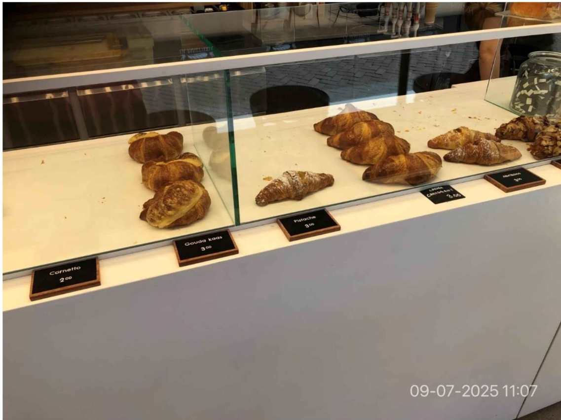
12. Vervolg vitrine. Diverse soorten croissants.