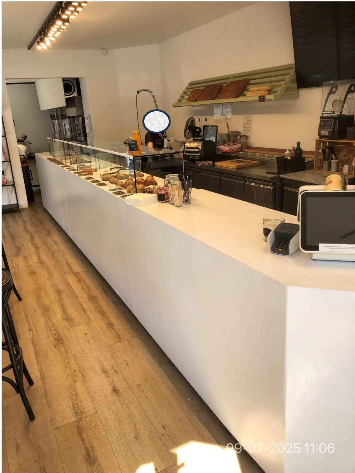
9. Overzicht van de gehele toonbank en de achterwand. Achterin is de doorgang naar het naast gelegen pand. Hierin bevinden zich een bereidingsruimte met werktafels, ovens, machines etc.