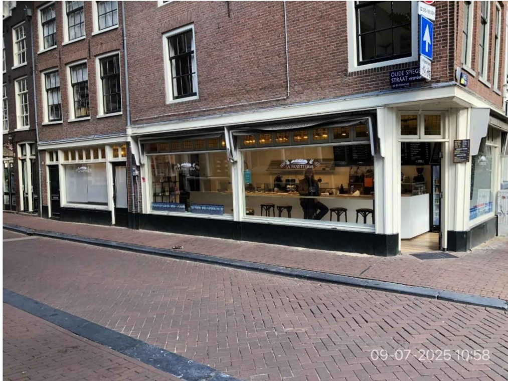
1. Gevel Oude Spiegelstraat . Zitgelegenheid met 5 krukken zichtbaar. Klant heeft etenswaar in een papieren zakje gekregen en is gaan zitten en wacht op haar koffie to go. Links met op de gevel nummer 2 is de deur en de ramen voorzien van rolgordijnen.