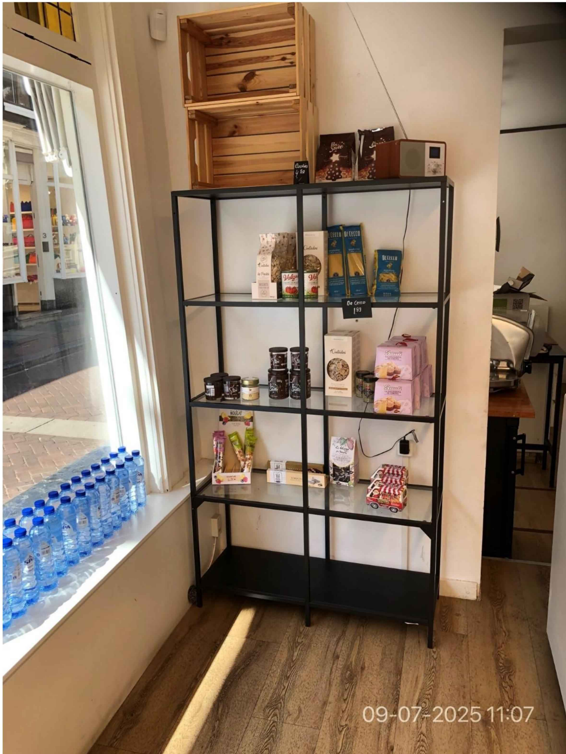
14. Achterin staat een kast met diverse soorten Italiaanse producten zoals diverse soorten pasta's, tomaten in blik, Bauli Italiaans brood/cake, nougat, pan di stella producten, cantucci etc.