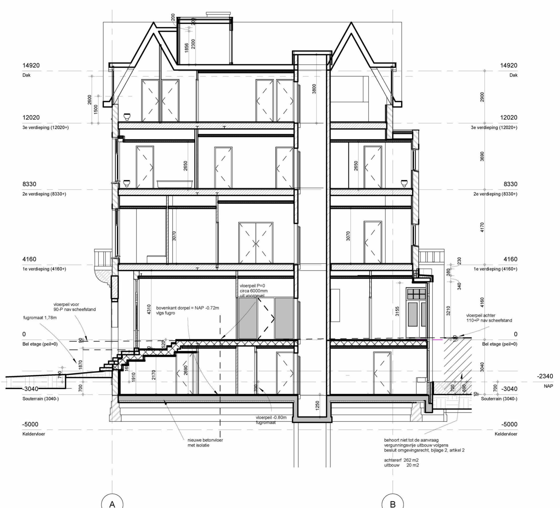
Doorsnede F-F 1 : 100