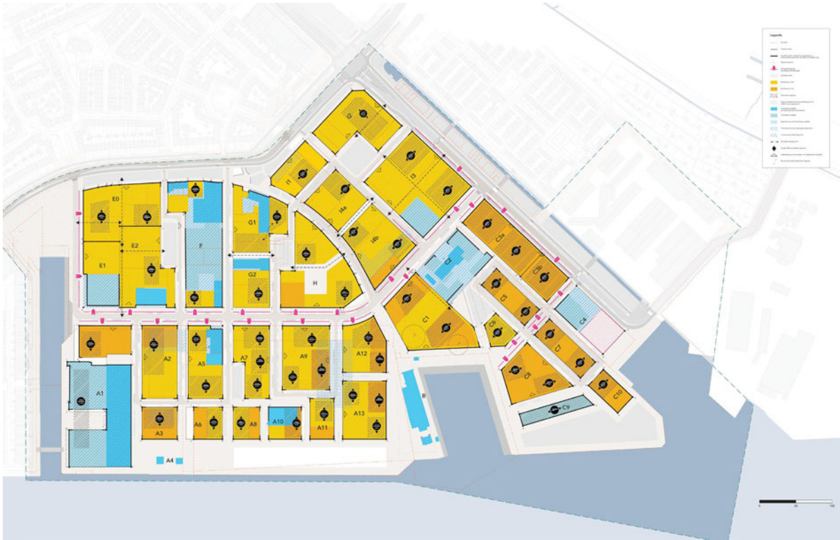
Figuur 2 Overzichtkaart blokspoornten Hamerkwartier, investeringsnota, R&D 2022

Bij vergelijking van deze twee kaarten met de nu voorgestelde orde kaarten Havens, Kantoren en Bedrijfsterrein zijn er een aantal verschillen te vinden.