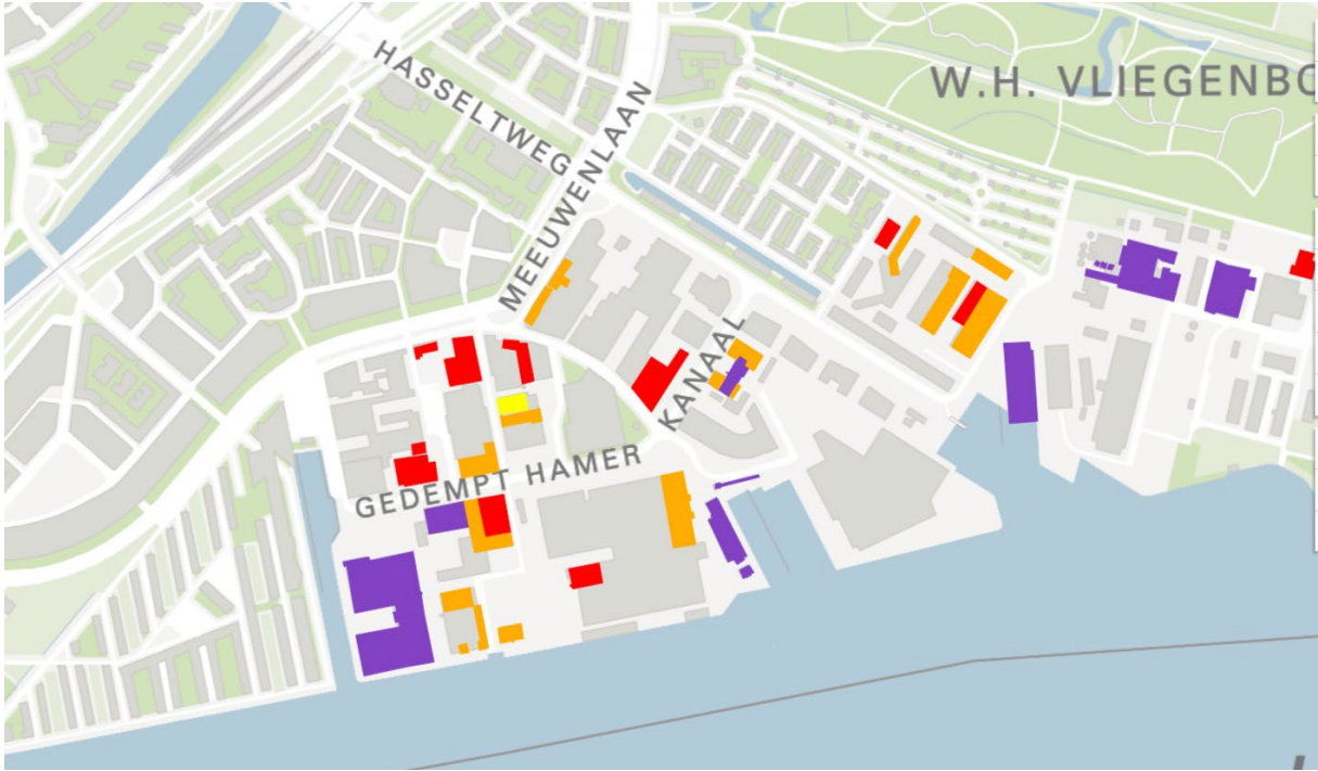
Figuur 3 Ordekaart Havens, kantoren en bedrijfsterrein, M&A 2024

Bij vergelijking van deze twee kaarten met de nu voorgestelde orde kaarten Havens, Kantoren en Bedrijfsterrein zijn er een aantal verschillen te vinden.